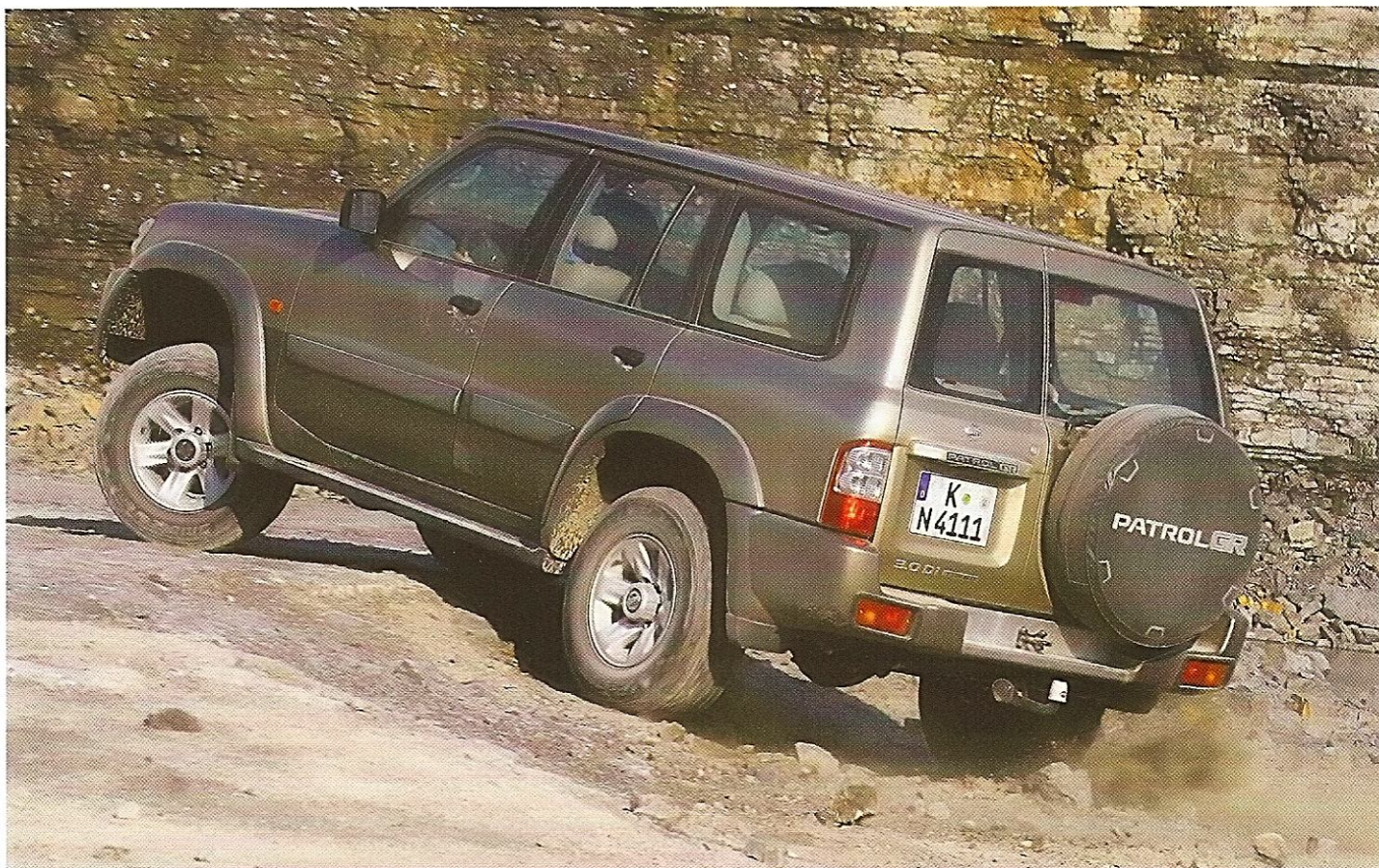
ЭТОТ NISSAN PATROL 1997 МОДЕЛЬНОГО ГОДА ЧУВСТВУЕТ СЕБЯ УВЕРЕННО И НА ГОРНЫХ ДОРОГАХ

в начале 80-х годов для сокращения транспортных расходов было решено построить заводы на европейском континенте — сначала в Испании, а затем в Великобритании и других странах. Выпускался Patrol и в Иране, откуда автомобиль поступал на рынки государств Ближнего Востока. В 1983 году Nissan Patrol 160 модернизировали, а в 1987 году появилось очередное поколение внедорожника.