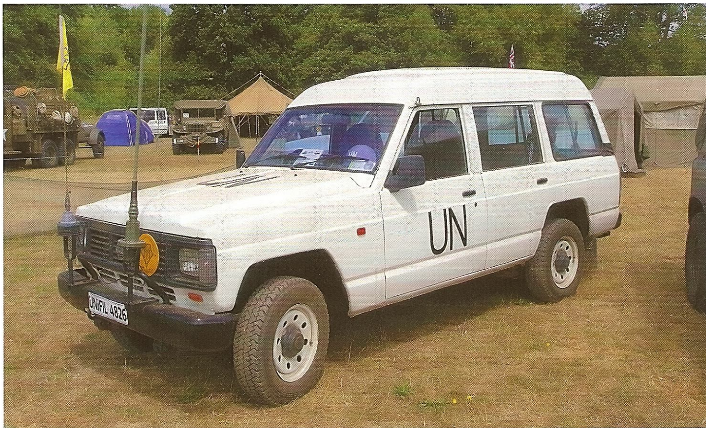
АВТОМОБИЛИ NISSAN RD28 С СИМВОЛИКОЙ ООН В СЕРЕДИНЕ 90-Х ГОДОВ УЧАСТВОВАЛИ В ГУМАНИТАРНЫХ ОПЕРАЦИЯХ ПО ВСЕМУ МИРУ

Были версии с длинными и короткими базами, полным и неполным приводом. На часть машин устанавливалось специальное медицинское оборудование и оборудование для пожарных команд. Выпускалась даже версия, предназначенная для киносъёмочных групп. Совершенствовались не только кузова, но и моторы. При этом автомобили еще долго оставались бензиновыми, а основной системы управления двигателем был карбюратор. «Шестидесятка» оказалась настолько удачной, что простояла на конвейере до 1979 года, когда ее сменил новый Nissan Patrol 160. В Японии модель была известна под названием Nissan Safari. На европейском рынке автомобиль появился в 1980 году. Разнообразие версий кузова, впечатляющая линейка моторов, предлагавшихся компанией, и уже ставшая легендарной надежность внедорожника снискали ему популярность по обе стороны океана. В линейке двигателей появились дизели, рассчитанные, прежде всего, на бережливых европейцев. Patrol стал популярным и в странах с плохо развитой дорожной сетью. Его широко использовали в Африке, Азии, Латинской Америке, а впоследствии в Австралии и Новой Зеландии. В Ирландии этот автомобиль был официально принят на «военную службу». Долгое время Nissan поставлялись на внешние рынки прямо из Японии, однако