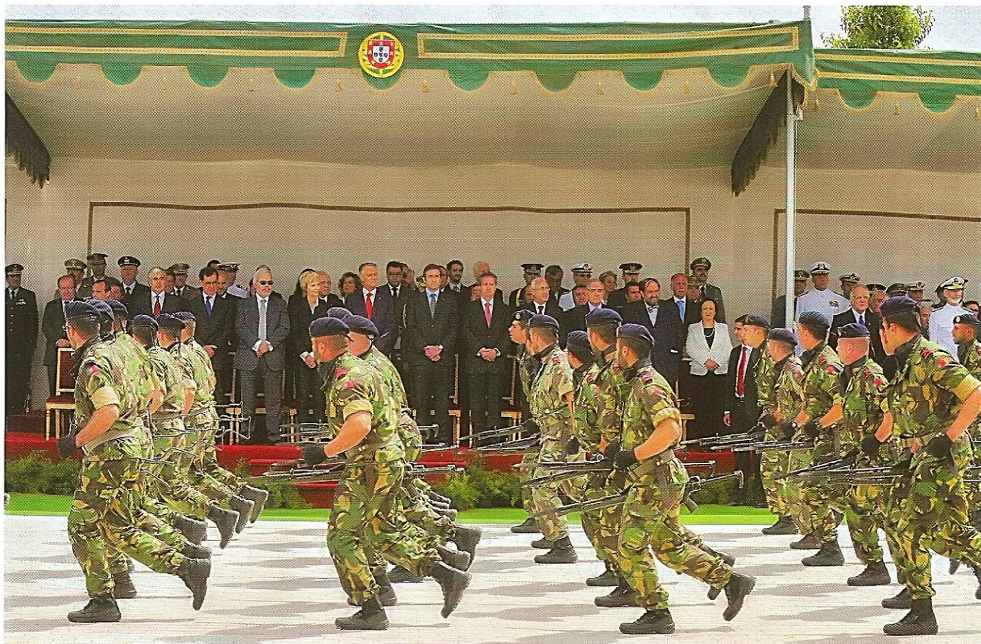
ПРЕЗИДЕНТ ПОРТУГАЛИИ АНИБАЛ АНТОНИУ КОВАКУ СИЛВА ИНСПЕКТИРУЕТ ПОДРАЗДЕЛЕНИЕ НАЦИОНАЛЬНЫХ ГВАРДЕЙЦЕВ (10 ИЮНЯ 2014 ГОДА)

Португальцы гордятся своим прошлым и своими государственными институтами. Один из них — национальная республиканская гвардия (Guarda Nacional Republicana, GNR) — ведет свою историю с 1801 года. Тогда, согласно королевскому указу, на свет появилось новое вооруженное формирование — королевская полицейская стража, или Guarda Real de Polícia, как называли ее сами португальцы.