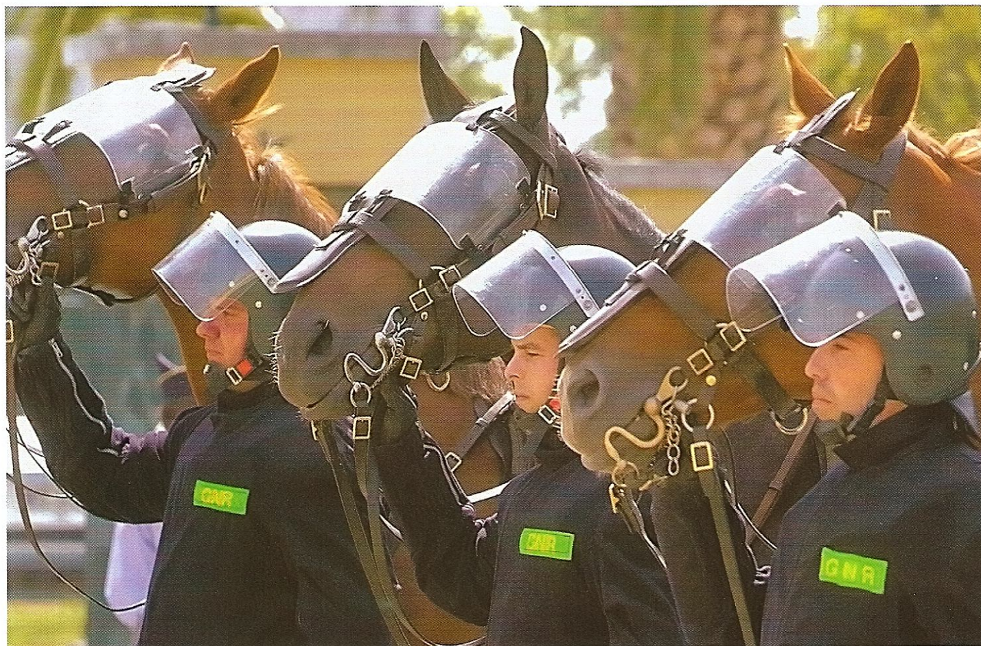
КОННЫЕ НАЦИОНАЛЬНЫЕ ГВАРДЕЙЦЫ ПОДДЕРЖИВАЮТ ПОРЯДОК ВО ВРЕМЯ ПРОВЕДЕНИЯ ФУТБОЛЬНЫХ МАТЧЕЙ

и катастрофах, выполнять обязанности почетного караула на государственных церемониях, во время визитов в страну иностранных делегаций, участвовать в парадах. По решению правительства они могут быть задействованы и в международных миротворческих операциях, проводимых Организацией Объединенных Наций, странами Европейского союза и Североатлантическим альянсом (НАТО).