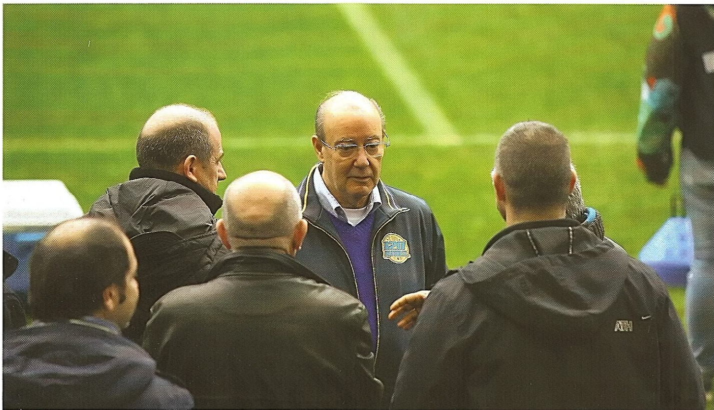
ПИНТУ ДА КОШТА И АНТЕРО ЭНРИКЕС С ТРЕНЕРСКИМ СОСТАВОМ «ПОРТУ» НА СТАДИОНЕ DRAGON (1 ЯНВАРЯ 2014 ГОДА)