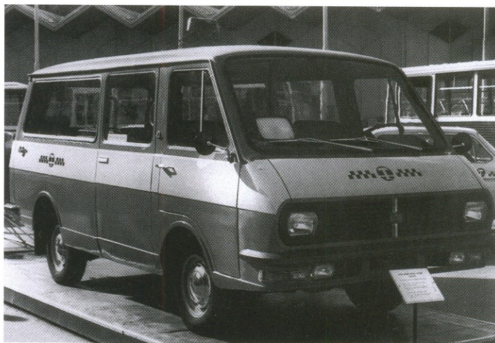
Микроавтобус РАФ-22032 «Латвия»

Служба маршруток активно развивалась и в других городах страны. Причем, в зависимости от местной специфики, маршрутные такси выполняли разные задачи. Например, в Москве и Киеве маршрутки довозили людей от метро до крупных торговых и промышленных объектов, в Ленинграде — позволяли туристам с комфортом добраться до парков и фонтанов в Пушкине,