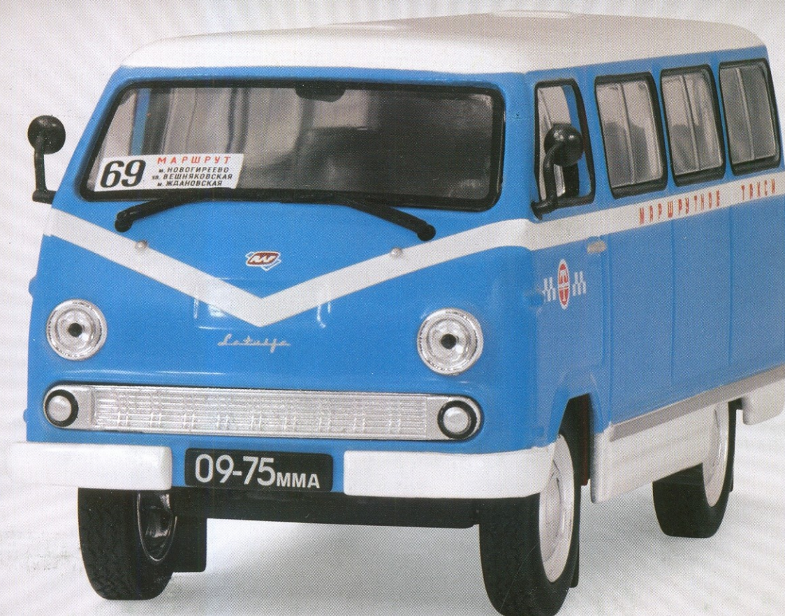
РАФ-977ДМ МАРШРУТНОЕ ТАКСИ