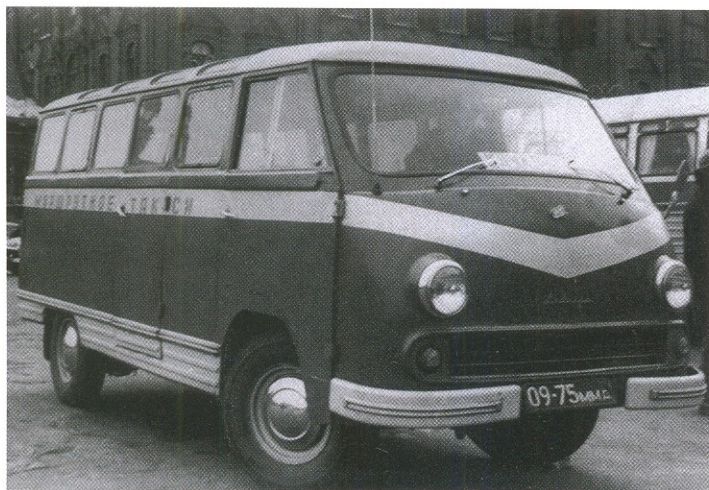
Микроавтобус РАФ-977Д «Латвия»

таксомоторов, состоящая из автомобилей «Москвич-408» и М-21. 12 ноября 1968 года Комбинат проката переименовали в 14-й таксомоторный парк, работа по прокату легковых автомобилей была прекращена. К 1976 году в парке насчитывалось 433 легковых такси «Волга» и 422 автомобиля РАФ на 40 маршрутных линиях. Численность работающих составляла 1709 человек.