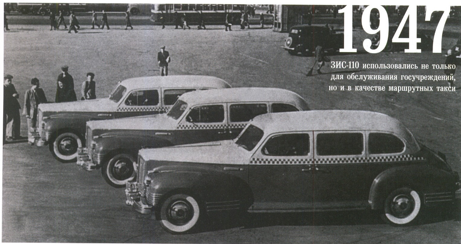
1947 ЗИС-110 использовались не только для обслуживания госучреждений, но и в качестве маршрутных такси

количество оставшихся машин обслуживало по договорам предприятия), а московские ЗиСы были законсервированы. Возрождение московского такси началось в 1945 году на базе Третьего таксомоторного парка. И началось именно с маршруток. Снятые с консервации ЗиС-101 выехали на маршруты по Садовому и Бульварному кольцу и от Рижского вокзала до площади Свердлова. На «садовом» и «рижском» маршрутах «коммунальные» автомобили высшего класса пользовались повышенным спросом, а вот на Бульварном кольце пассажиры игнорировали маршрутки. Из-за небольшого количества работы и обилия зеленых насаждений таксисты прозвали «бульварный» маршрут «кислородным». На него в виде наказания «ссылали» проштрафившихся водителей.