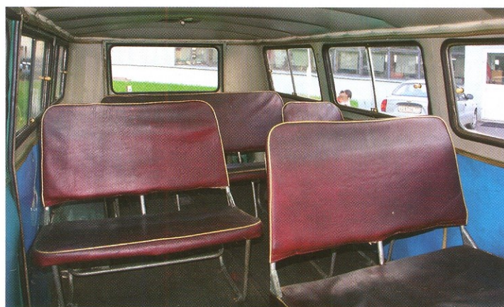
Салон маршрутного такси РАФ-977ДМ «Латвия»

К сожалению, микроавтобусы РАФ всех поколений не отличались долговечностью. Машины изначально обладали множеством «врожденных» недостатков, наиболее существенными из которых считались чрезмерная перегрузка переднего моста и слабая конструкция несущего (безрамного) кузова. В результате, интенсивную эксплуатацию в маршрутном такси РАФики выдерживали