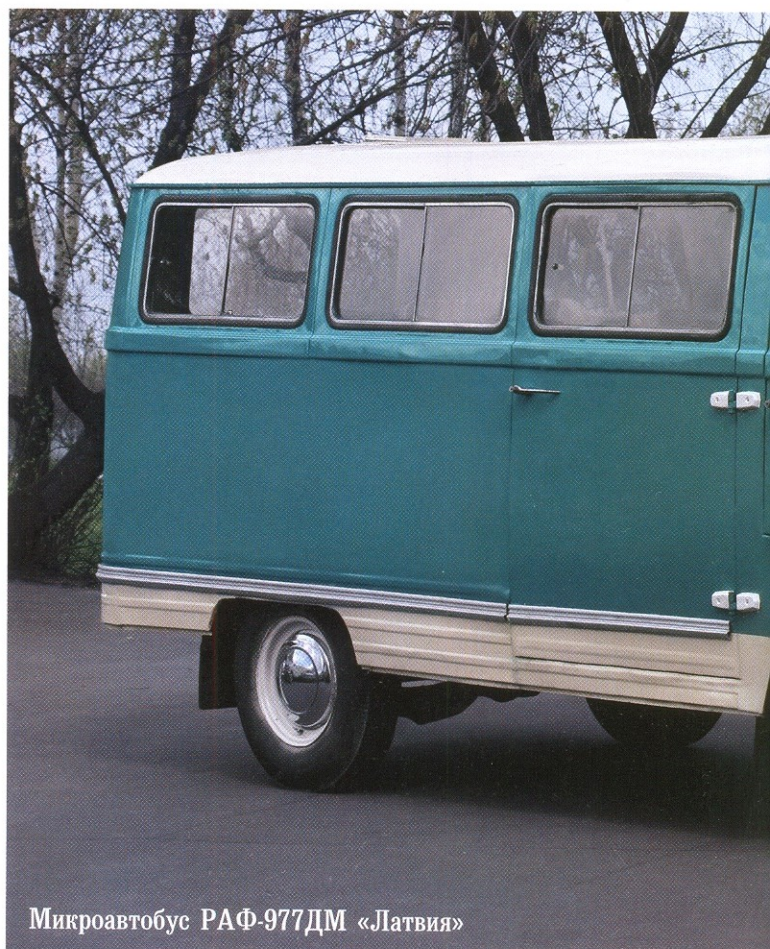
Микроавтобус РАФ-977ДМ «Латвия»

Небольшие автобусы, базирующиеся на агрегатах легковых автомобилей, были созданы по инициативе рижских конструкторов в 1957 году — редкий случай в плановой экономике советского государства. Рижанам удалось убедить руководство Министерства автомобильной промышленности в том, что страна нуждается в новом виде подвижного состава, названного «микроавтобусами», и получить финансирование на развитие своего проекта. Обычно все происходило наоборот — государство решало, что