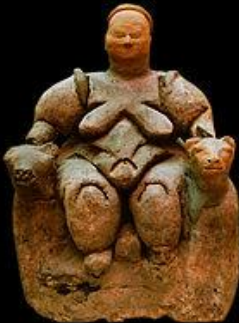
Богиня-мать на троне с львицами из Чатал-Хююк (около 6000 лет до н.э., Музей анатолийских цивилизаций, Турция).