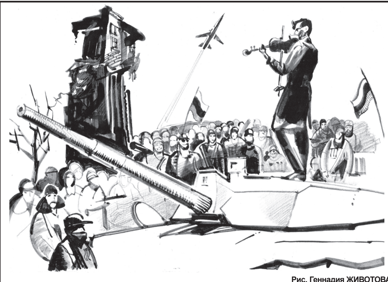
Рис. Геннадия ЖИВОТОВА

Русская Мечта — в работах современных русских философов-духовидцев, разгадавших "тайну