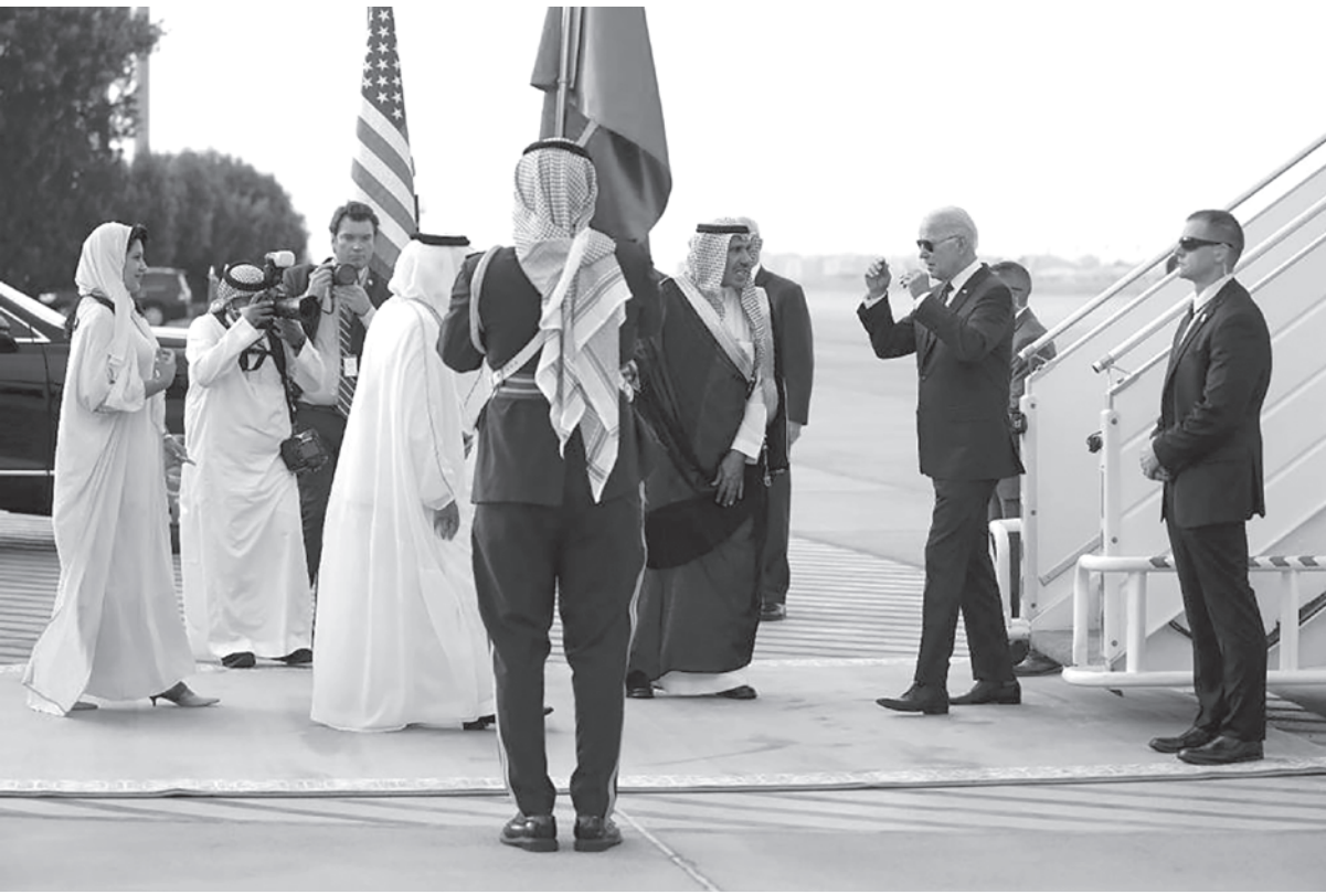
Так встретили Байдена

Визит на Ближний Восток показывает, что американцы стараются обходить все резолюции ООН по вопросу Палестины. А это означает полный провал этого визита, подлинная цель которого заключалась в продвижении американских интересов за счёт интересов государств арабского мира, в намерении создать антиарабскую арабскую коалицию — так называемое Арабское НАТО. Но это нанесло бы ущерб арабо-китайским и арабо-российским отношениям, поступательно развивающимся в последние годы.