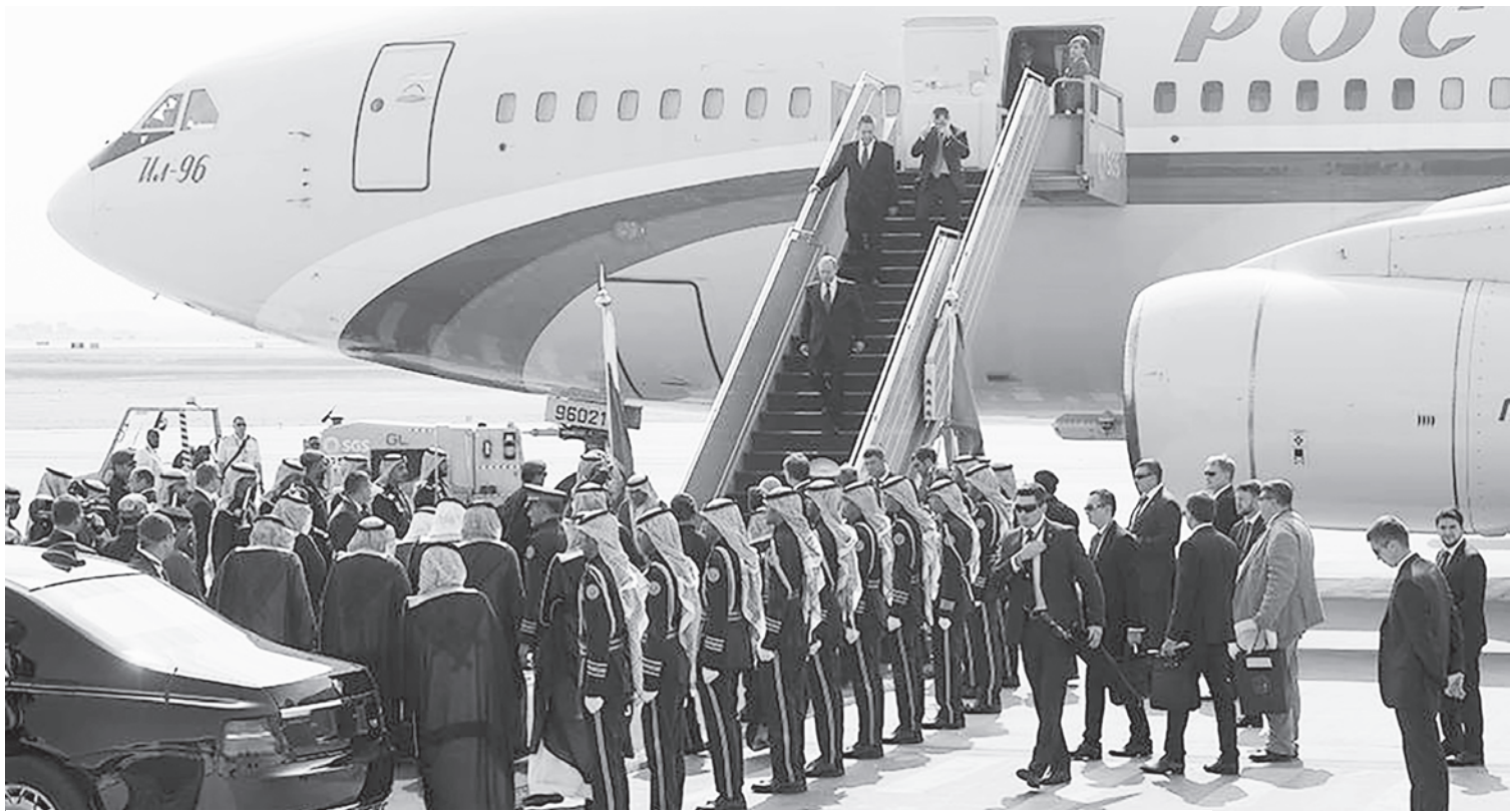
Так встречали Путина