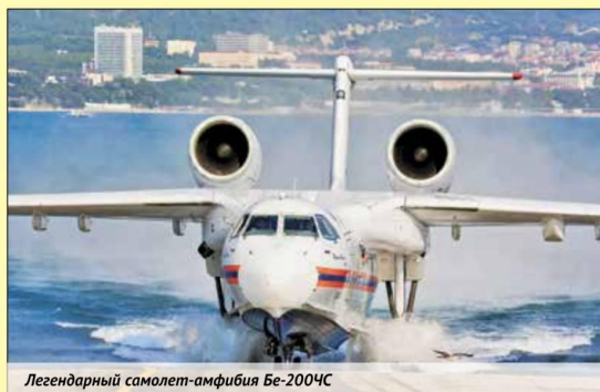
Легендарный самолет-амфибия Бе-200ЧС