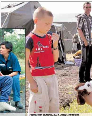
Ростовская область, 2014. Лагерь беженцев

учебных заведениях и организациях ведомства — это более 800 человек во всех регионах страны.