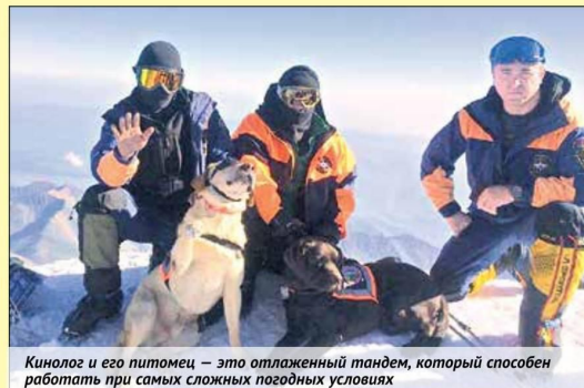
Кинолог и его питомец — это отлаженный тандем, который способен работать при самых сложных погодных условиях