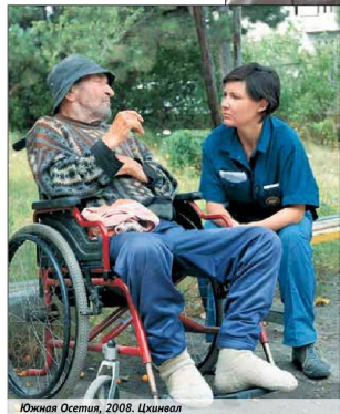
Южная Осетия, 2008. Цхинвал