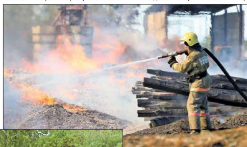
Хакасия, 2017 год. Ликвидация крупного пожара

та «выстрелила» Шира, но там мы за сутки вопрос решили. Потом пошли трудности с небольшими ручейками. 25 и 31 марта в республике выпало от восьми до десяти норм осадков в виде снега, что еще больше усложнило обстановку. Всего от паводка в этом году пострадали 34 населенных пункта в 10 из 13 районов республики. Но все