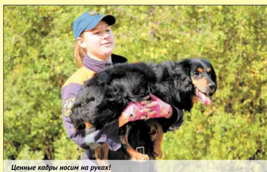
Ценные кадры носим на руках!

А если у вас есть интересный материал, который понравится нашим подписчикам, вы можете оформить и предложить свой пост в сообщениях сообществ МЧС России в социальных сетях.