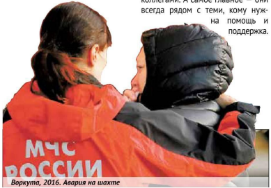
Воркута, 2016. Авария на шахте