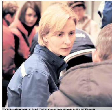
Санкт-Петербург, 2015. После авиакатастрофы рейса из Египта

За 19 лет работы психологи МЧС России, завоевав уважение и признание сотен тысяч россиян и иностранных граждан, стали высочайшими профессионалами, что позволяет им делиться накопленным опытом не только с другими ведомствами, но и с зарубежными коллегами. А самое главное — они всегда рядом с теми, кому нуж-