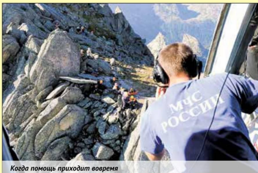
Когда помощь приходит вовремя