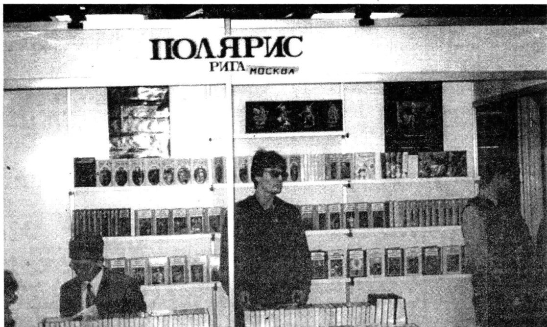
Стенд издательства «Полярис» на Московской книжной ярмарке «Книга и все для книги» НАШИ КНИГИ НЕЛЬЗЯ НЕ ЗАМЕТИТЬ

Продолжается издание Полного собрания фантастических произведений Роджера Железны. Увидел свет третий том собрания, в который вошли романы «Дорожные знаки», «Двери в песке».