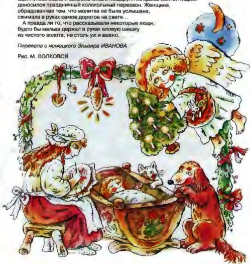
Рис. М. ВОЛКОВОЙ