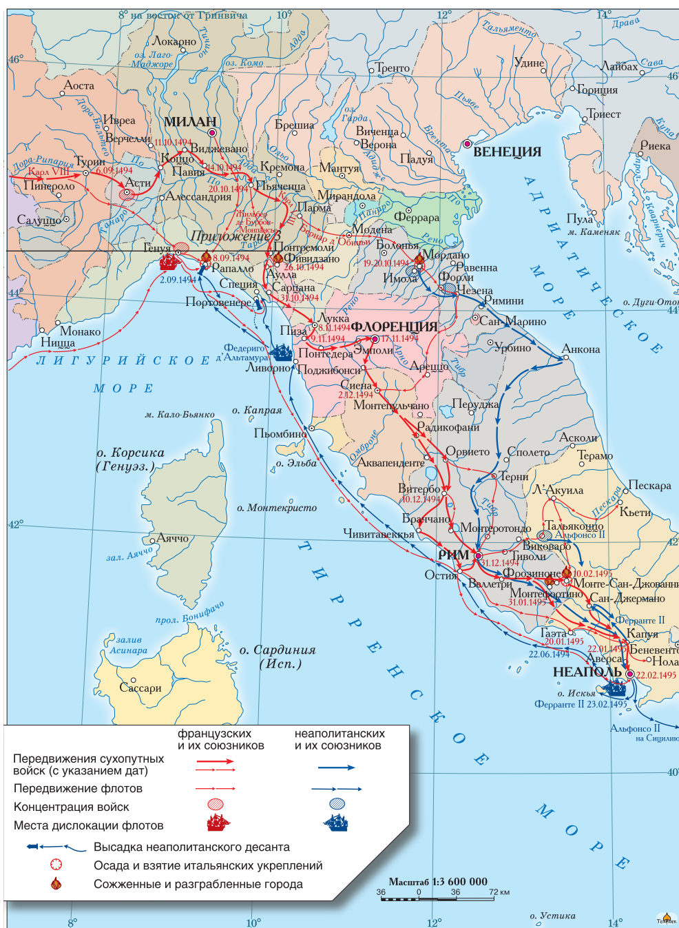
Итальянский поход Карла VIII (август 1494 – февраль 1495 г.)