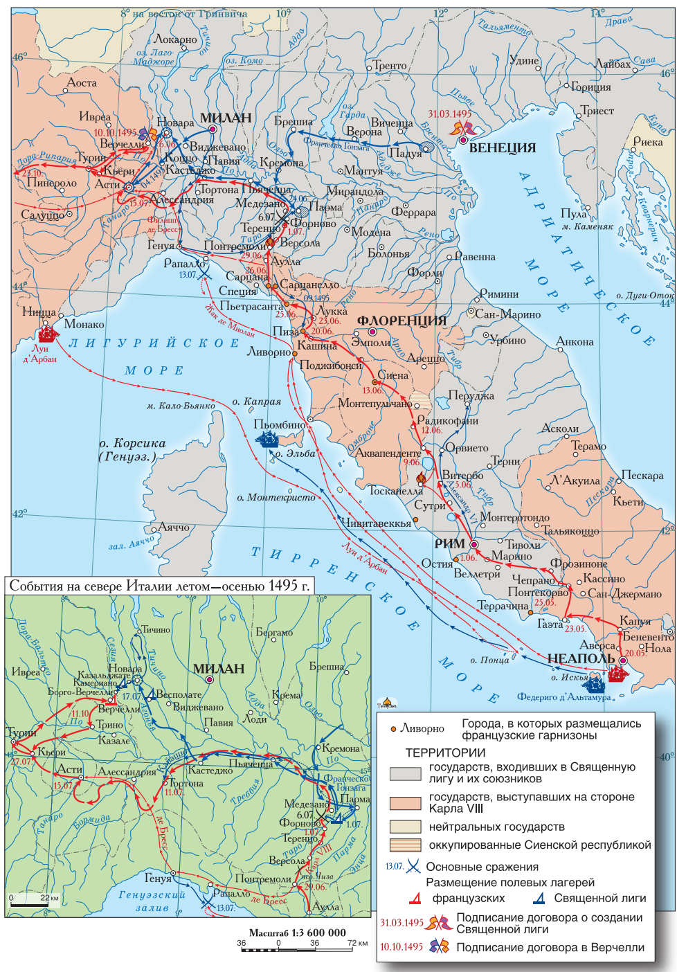
Военные действия в Италии после создания Священной лиги и возвращение Карла VIII во Францию (1495 г.)