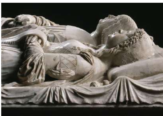
Кенотаф Лодовико «Моро» Сфорца и его супруги Беатриче д'Эсте