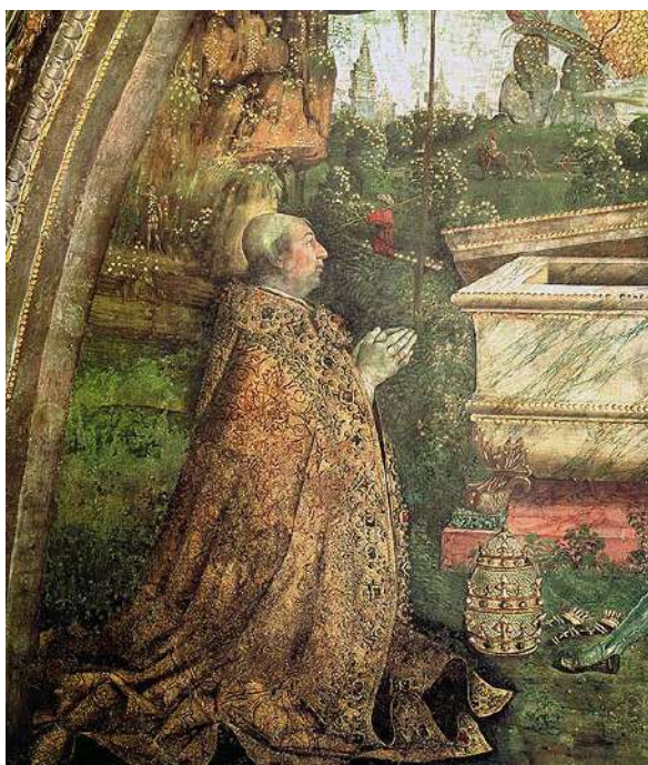
Папа Александр VI

Деталь фрески «Воскресение Христово» из росписей Апартаментов Борджа, Ватикан. Автор – Бернардино Пинтуриккьо или его ученики, около 1494 г.