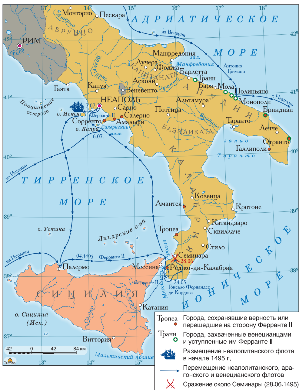
Военные события в Неаполитанском королевстве (1495 г.)