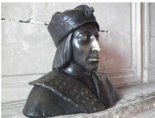
Карл VIII Валуа

Бронза, автор – неизвестный скульптор из круга Антонио дель Поллайоло, около 1495 г. Фотография экземпляра из замка Лош, Франция.