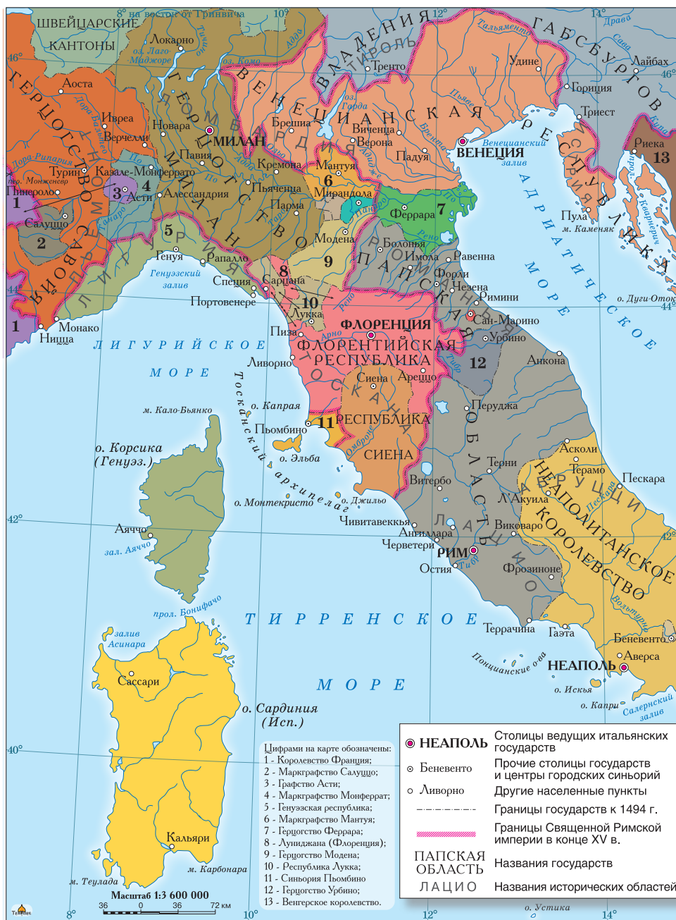
Политическая карта Италии в конце XV в.