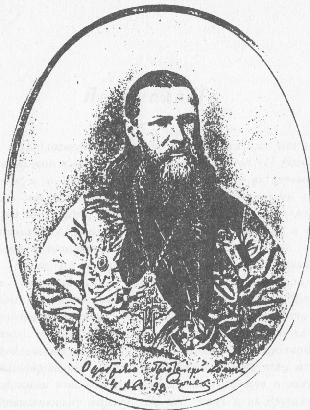
Св. Праведный о. Иоанн Кронштадтский