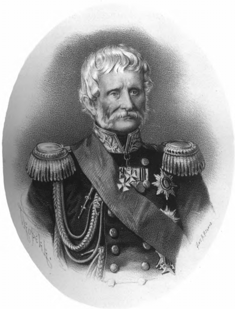
ГЕНЕРАЛЪ - АДЪЮТАНТЪ БАРОНЪ ЖОМИНИ.