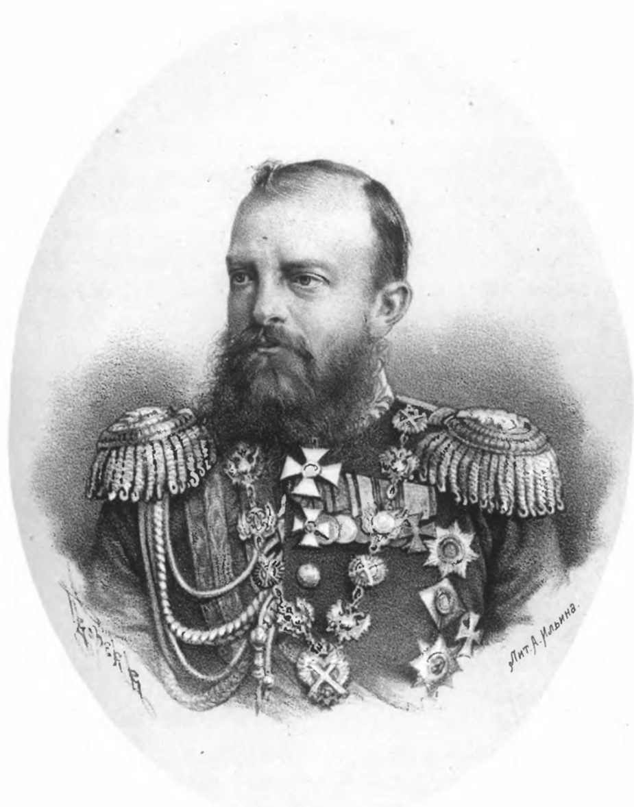
Е. И. В. ВЕЛИКІЙ КНЯЗЬ МИХАИЛЪ НИКОЛАЕВИЧЪ.