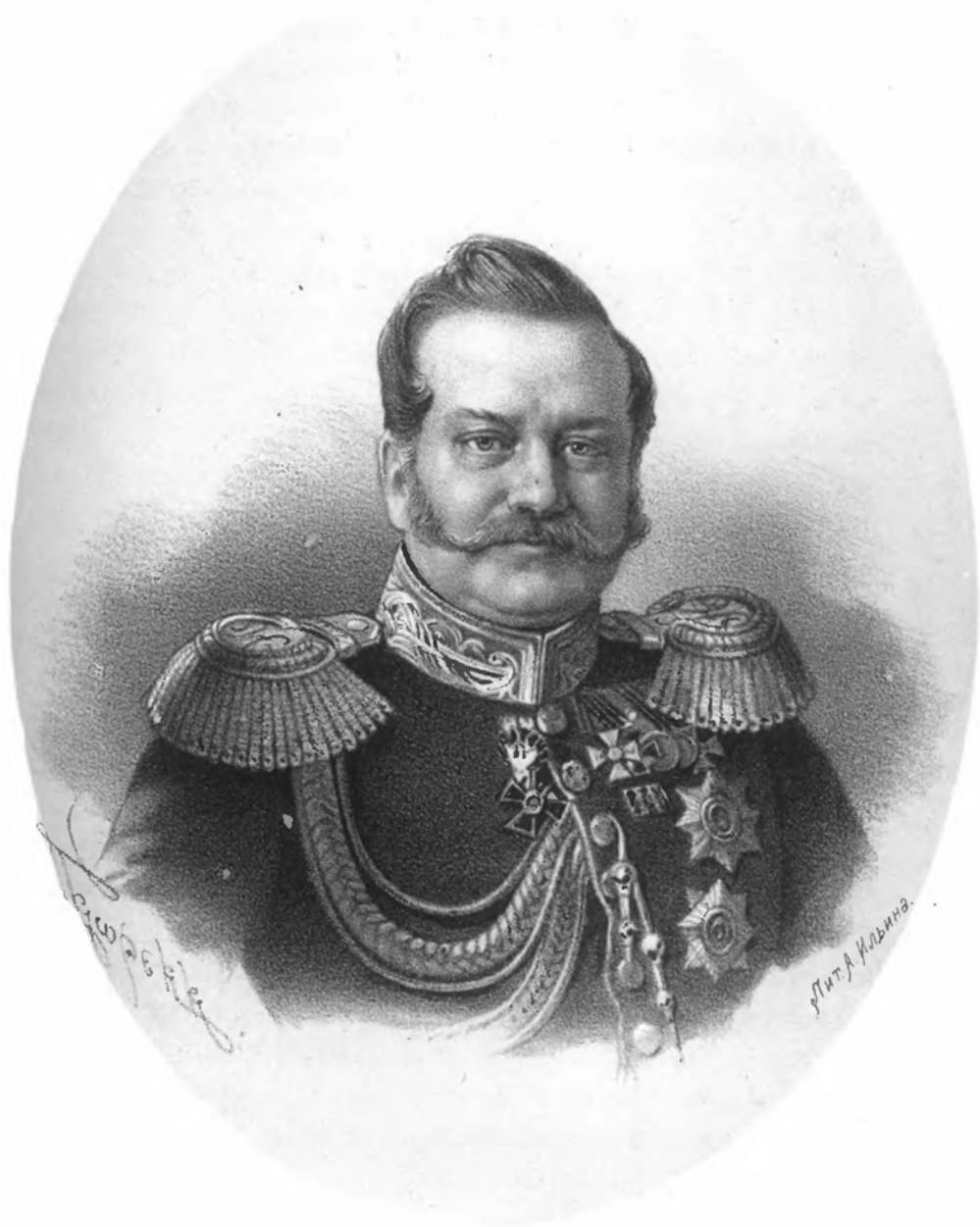
ГЕНЕРАЛЪ - АДЪЮТАНТЪ ГРАФЪ РОСТОВЦЕВЪ.