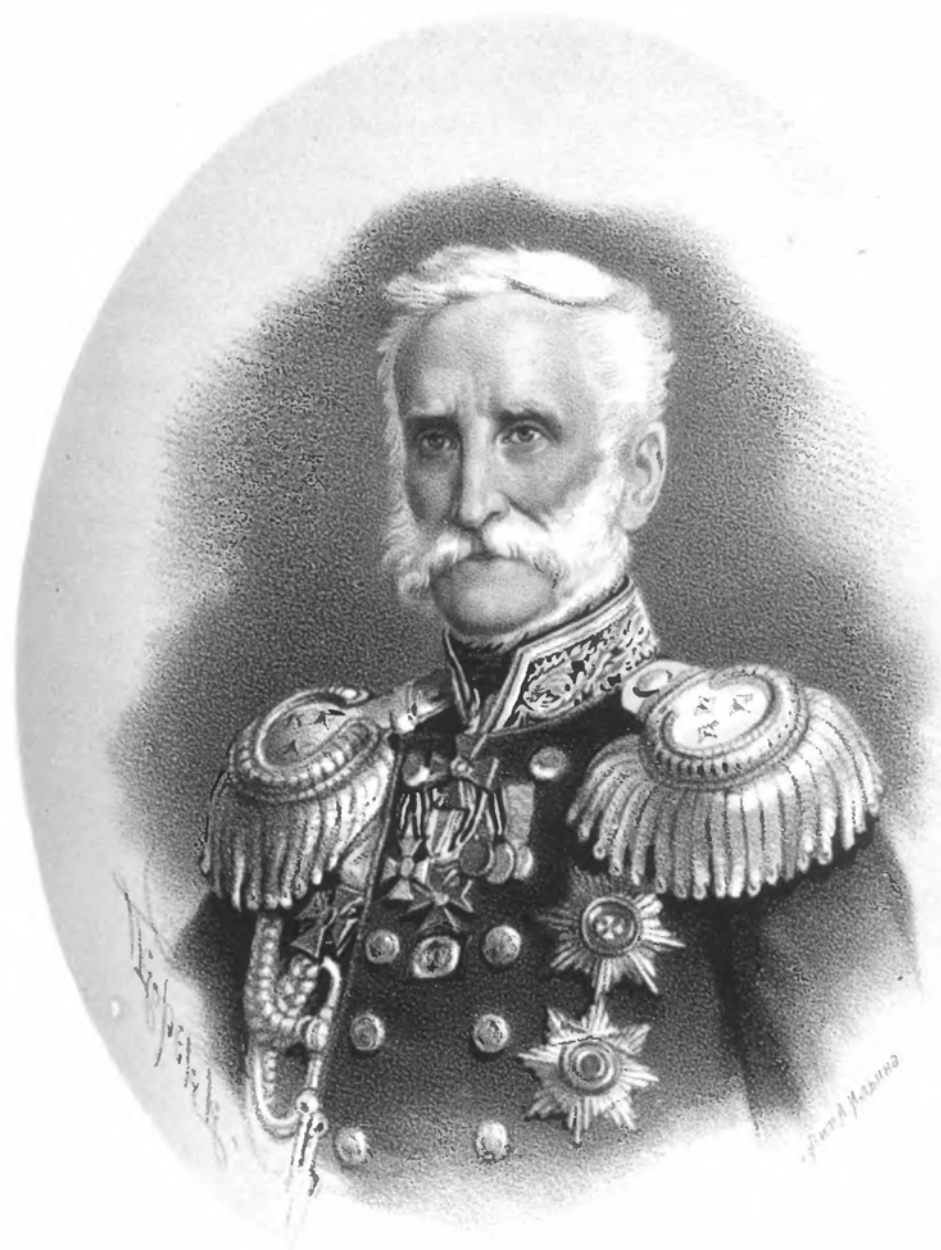
ГЕНЕРАЛЪ - ЛЕЙТЕНАНТЪ СТЕФАНЪ.