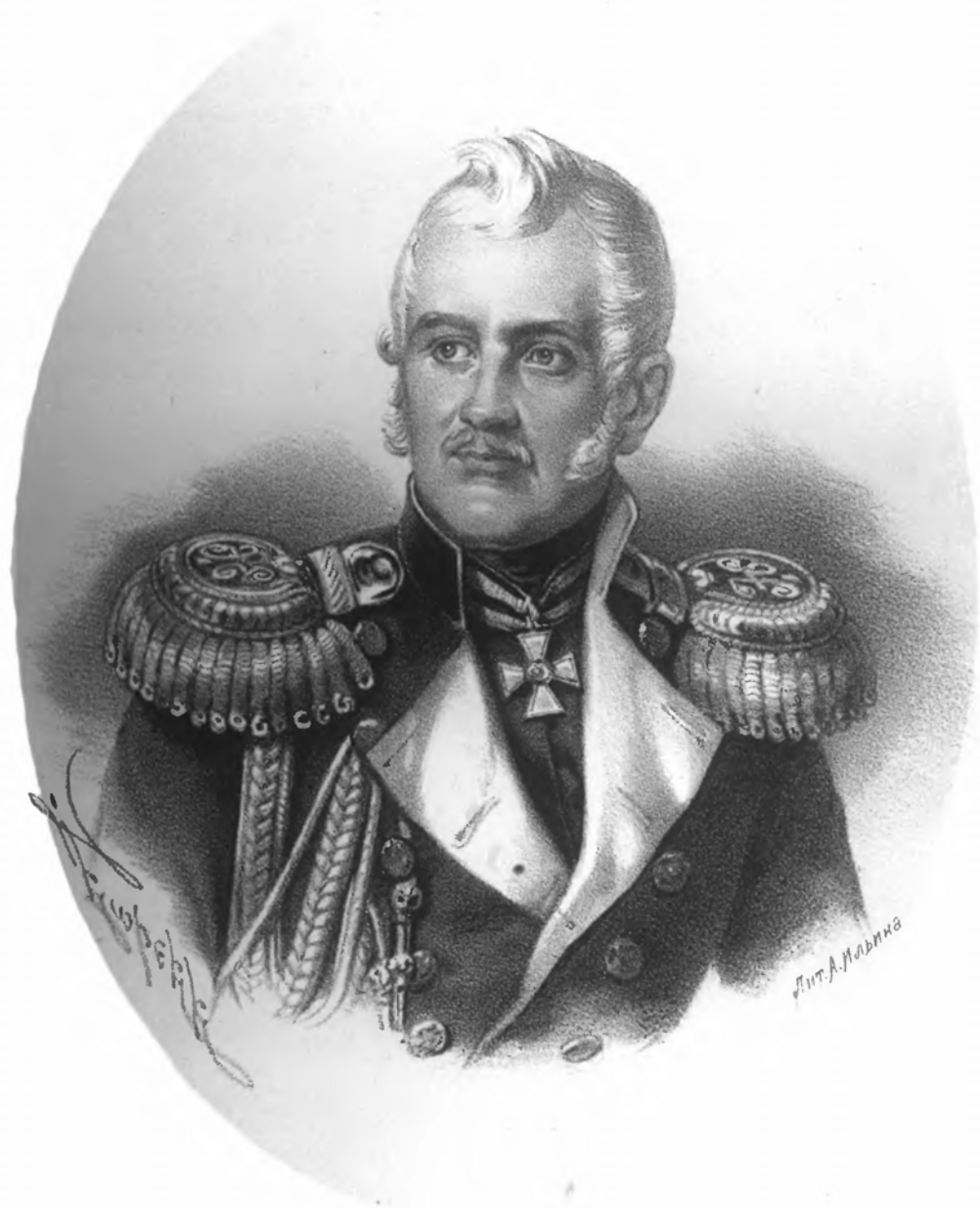
ГЕНЕРАЛЪ - АДЪЮТАНТЪ СУХОЗАНЕТЪ.