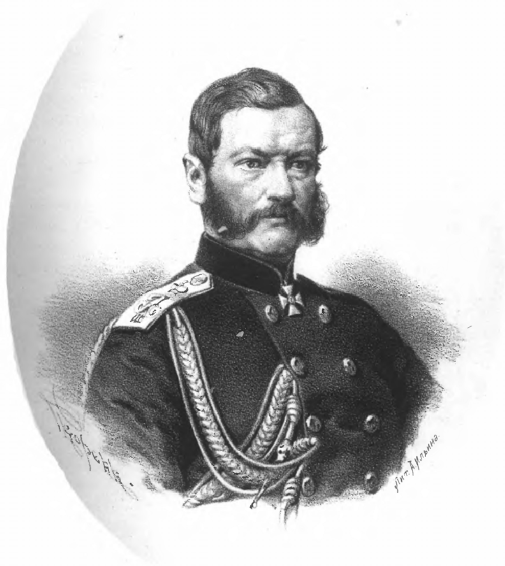
ГЕНЕРАЛЪ - АДЪЮТАНТЪ БАУМГАРТЕНЪ.