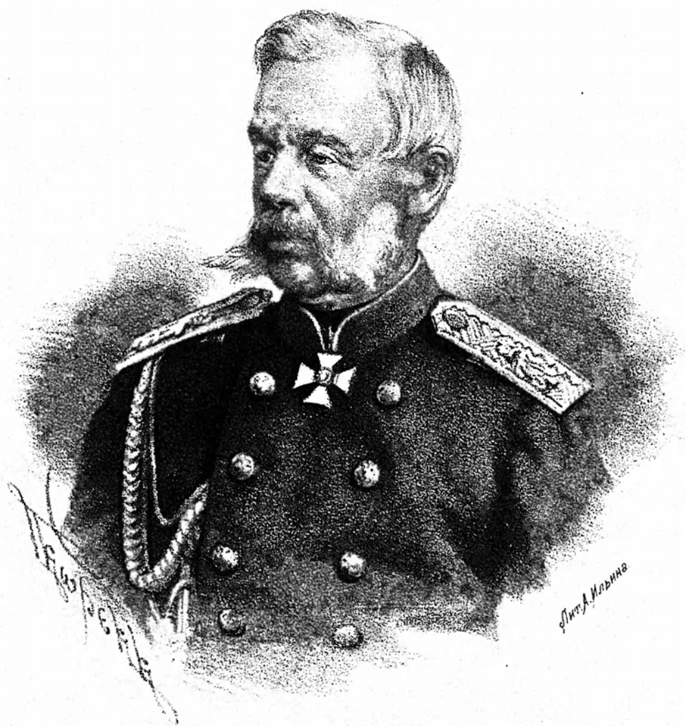
ГЕНЕРАЛЪ - АДЪЮТАНТЪ ГРАФЪ МИЛЮТИНЪ.