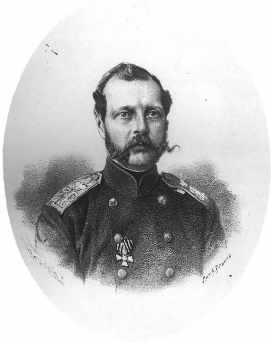
ИМПЕРАТОРЪ АЛЕКСАНДРЪ II.