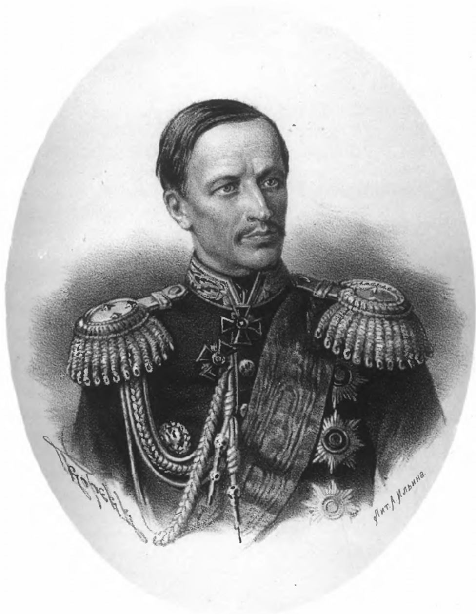
ГЕНЕРАЛЪ - ЛЕЙТЕНАНТЪ ЛЕОНТЬЕВЪ.