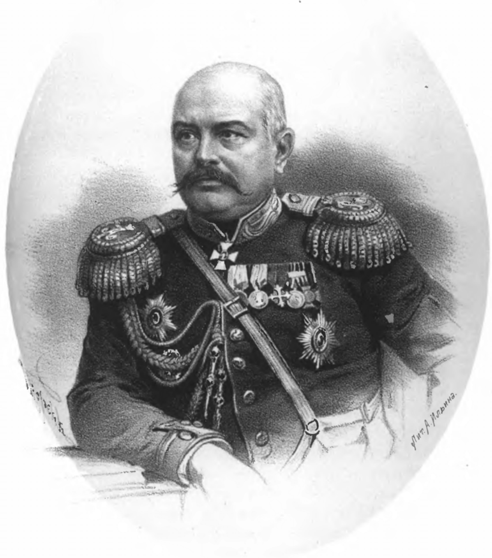
ГЕНЕРАЛЪ - АДЪЮТАНТЪ ДРАГОМИРОВЪ.