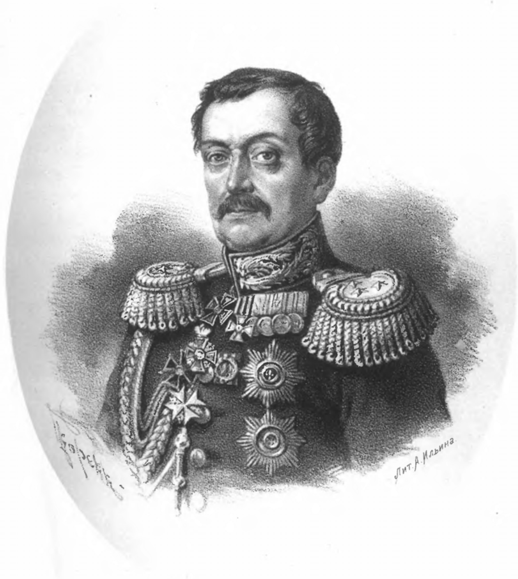
ГЕНЕРАЛЪ - ЛЕЙТЕНАНТЪ РЕННЕНКАМПФЪ.