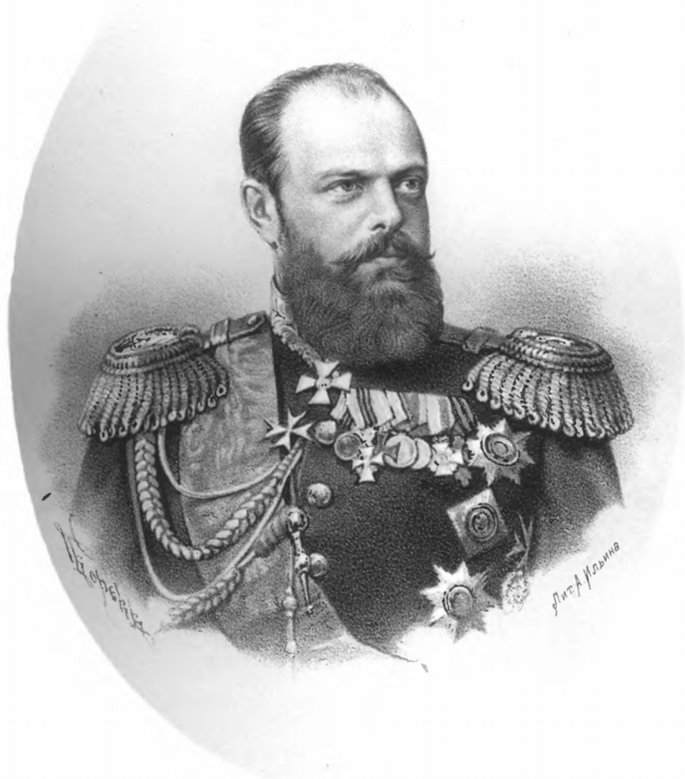
Е. И. В. ГОСУДАРЬ ИМПЕРАТОРЪ АЛЕКСАНДРЪ АЛЕКСАНДРОВИЧЪ.