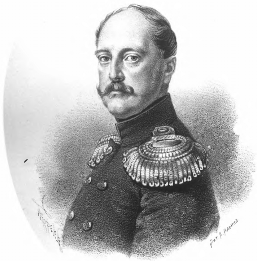
ИМПЕРАТОРЪ НИКОЛАЙ I.