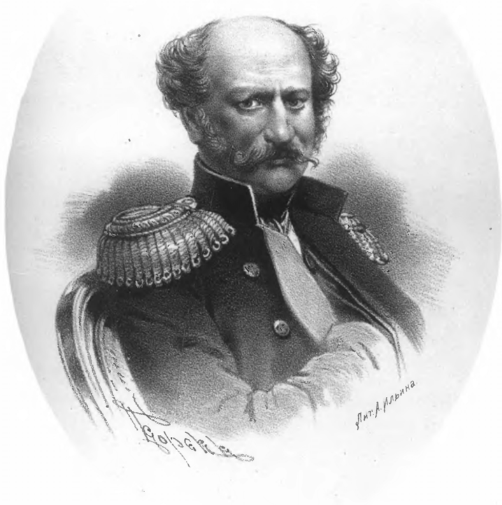
ГЕНЕРАЛЪ - ЛЕЙТЕНАНТЪ БАРОНЪ ЗЕДДЕЛЕРЪ.