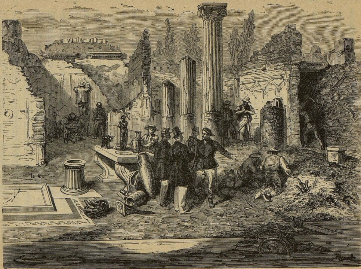
ФОРУМЪ, БАЗИЛИКА, ХРАМЪ ВЕНЕРЫ.