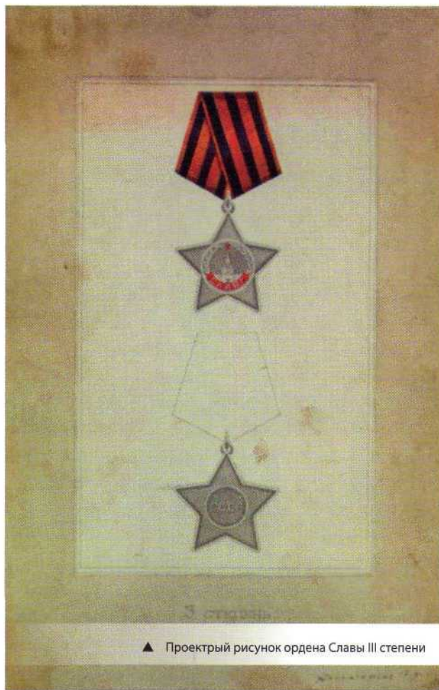
▲ Проектный рисунок ордена Славы III степени

Орден имел несколько особенностей, которых не было ни у какой другой отечественной награды. Во-первых, это единственное боевое отличие, предназначенное для награждения исключительно солдат и сержантов (в авиации также и младших лейтенантов). Во-вторых, награждение им осуществлялось только в восходящем порядке, начиная с младшей – III степени. Данный порядок был повторен лишь через тридцать лет в статутах орденов Трудовой Славы и «За службу Родине в Вооруженных Силах СССР». В-третьих, орден Славы до 1974 года был единственным орденом СССР, выдававшимся только за личные заслуги и никогда не выдававшимся ни воинским частям, ни предприятиям, ни организациям. В-четвертых, статут ордена предусматривал повышение кавалеров всех трех степеней в звании, что являлось исключением для советской наградной системы. В-пятых, цвета ленты ордена Славы повторяют расцветку ленты российского императорского ордена Святого Георгия, что в сталинские времена было, по меньшей мере, неожиданным. В-шестых, цвет и рисунок ленты были одинаковы для всех трех степеней, что было характерно только для дореволюционной наградной системы, но никогда не использовалось в наградной системе СССР.