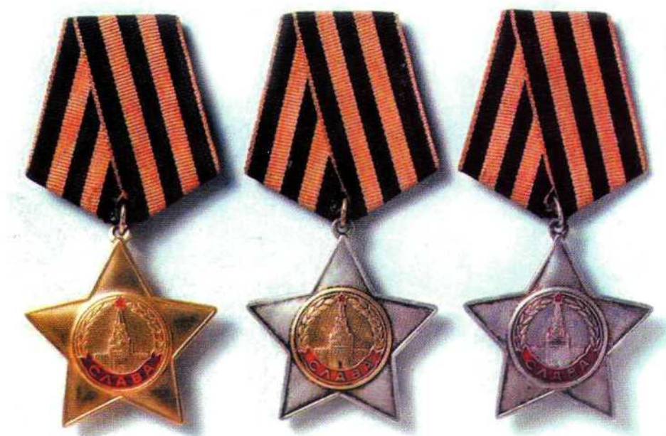
▲ Ордена Славы трех степеней - образцы

Планка с орденской лентой всех трех степеней носится после планки ордена «За личное мужество».