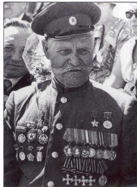
▲ Герой Советского Союза донской казак К. И. Недорубов (1889–1972)