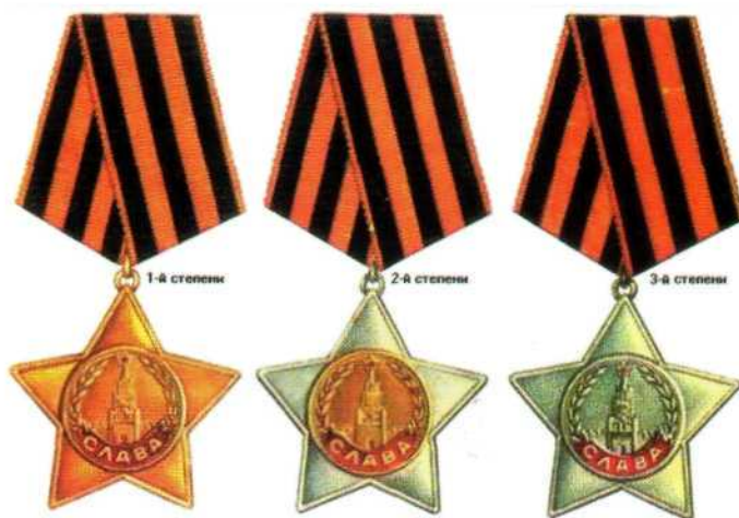
▲ Ордена Славы трех степеней – эскизы