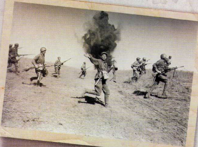
▲ Главными претендентами на награждение орденом Славы были обычные пехотинцы, тянувшие основную лямку той страшной войны... Фото 1942 года.