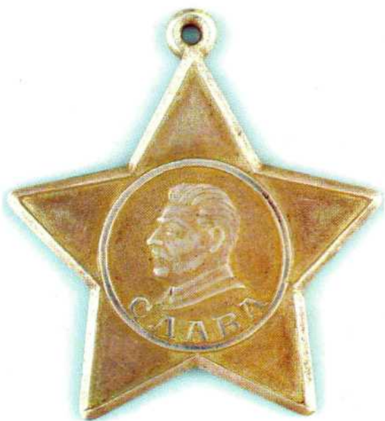
▲ Проектный образец ордена Славы

осенью сорок первого года в осажденной Москве – тогда художник создал награду для доблестных защитников столицы.