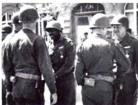
▲ Американские солдаты - кавалеры ордена Славы

Например, Роза Егоровна Шанина — советский одиночный снайпер отдельного взвода снайперов-девушек 2-го стрелкового батальона 1138-го стрелкового полка 184-й Духовщинской Краснознаменной стрелковой дивизии 3-го Белорусского фронта, кавалер орденов Славы II и III степеней