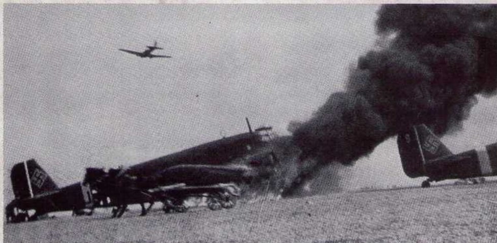
▲ Советский штурмовик Ил-2 (слева в небе) атаковал аэродром немецкой транспортной авиации

1-я танковая армия Клейста подходит к Миллерово, 17-я армия достигает Ворошиловграда. Остатки 21-й