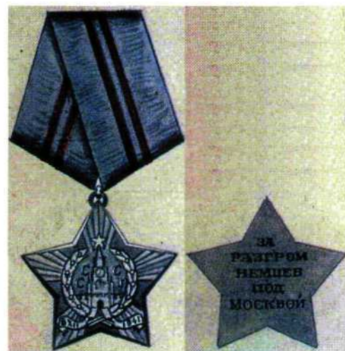
► Проектный рисунок Москалева – медаль «За оборону Москвы»