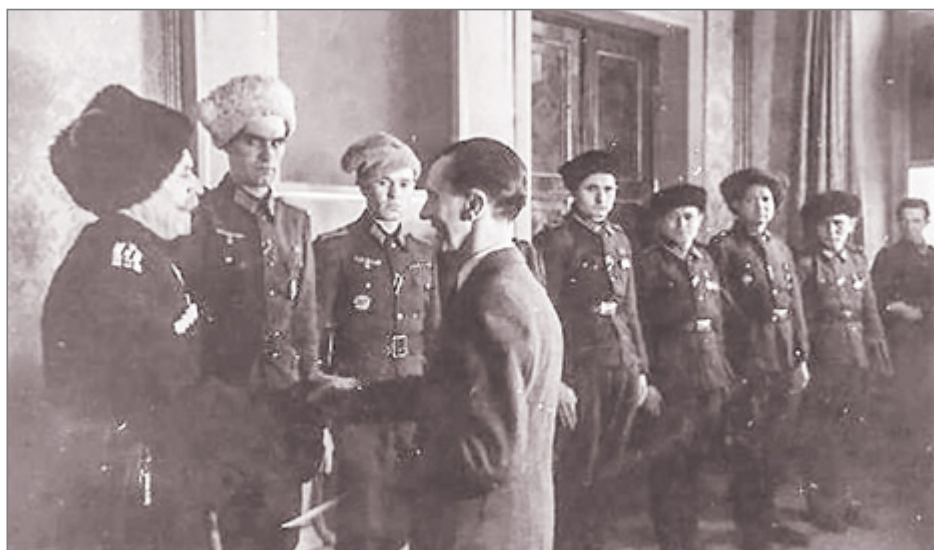
Й. Геббельс вручает награды рейха И. Кононову и донским казакам, воевавшим на стороне Гитлера.

дованием И. Броз Тито. После оккупации Югославии в 1941 г., стоявший во главе русской эмиграции в Сербии генерал М.Ф. Скородумов 71 обратился в штаб германского главнокомандующего с предложением сформировать русскую воинскую часть. 12 сентября он получил письменный приказ о формировании Отдельного русского корпуса из русских офицеров, солдат и казаков, служивших в белогвардейских воинских частях. Многие из этих людей читали «Майн кампф» и отлично знали истинные цели и намерения нацистов в отношении своей родины, но видели в коммунистах гораздо более опасных врагов. Общекубанский чрезвычайный сбор в Белграде принял решение о поступлении кубанских казаков на службу в это воинское соединение. В первые дни формирования Скородумов был смещен и арестован, корпус возглавил генерал Б.А. Штейфон, бывший полковник Генштаба Русской армии, участник Гражданской войны на стороне «белых». Корпус был переименован в «Русскую охранную группу» и подчинен германскому хозяйственному управлению в Сербии. Сразу же по окончании формирования, а иногда не успев пройти военного обучения, части отправлялись в карательные операции против югославских партизан. Действия группы получили превосходные оценки германского командования, в