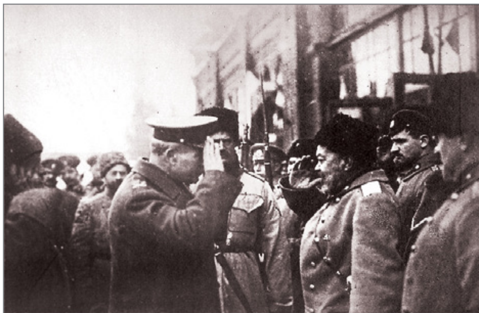
Главнокомандующий Вооружёнными силами Юга России А.И. Деникин и английский генерал Ф. Пуль

Взаимодействие интервентов с белогвардейцами включало в себя не только военную и материальную помощь, но и прямое управление их действиями, в частности установление единоначалия. Под давлением Франции и Великобритании Краснов был вынужден под-