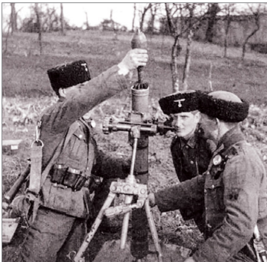
Минометный расчет казаков-коллаборационистов ведет обстрел советских войск.

Первым воинским формированием, в котором служили казаки-коллаборационисты, стал Русский охранный корпус на Балканах 70 . Нацистскому командованию было необходимо высвободить свои силы для советско-германского фронта, поэтому оно согласилось с формированием РОК и обеспечило его оружием и амуницией, чтобы его части боролись против югославских партизан, воевавших под коман-