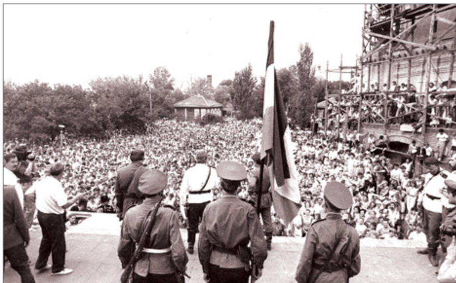
Казачий круг в Старочеркасской станице (Ростовская область), 1990 г.

В основе современного казачьего национализма лежит та же самая историческая концепция Е. Савельева, развитая в первую очередь стараниями эмигрантов в рамках польско-французского проекта «Прометей». На ее основе появился исторический миф, формирующий национальную основу для казаков, построенный на представлении о казаках как о древнем народе, имевшем независимое государство и жившем по своим традициям. В длительной борьбе с врагами, прежде всего, с Русским государством, «казачий народ» потерпел поражение и был превращен в служилое сословие. Нисколько не смущаясь антиисторичностью этой концепции, казачьи националисты игнорируют все исторические и архивные документы, подтвержда-