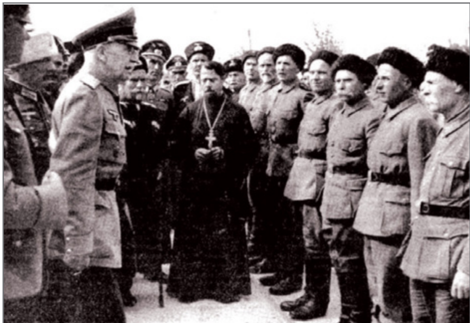
Визит бригаденфюрера СС П.Н. Краснова к ветеранам гражданской войны, сентябрь 1943 г.

серьезных поражений, но и найти ресурсы для войны на два фронта. Казачьи части оченьгодились в этой критической ситуации. Было принято решение о разворачивании казачьей дивизии фон Паннвица в кавалерийский корпус, который был зачислен в войска СС. Для этой цели при Главном штабе СС создавался специальный орган – Резерв казачьих войск, начальником которого приказом рейхсфюрера СС Г. Гиммлера был назначен группенфюрер А. Шкуро. «Казачий резерв» на правах штаба национального легиона СС отвечал за вербовку и подготовку казаков для службы в войсках СС, в частях СД и полиции. Казачьи подразделения вместе с частями СС подавляли Варшавское восстание и воевали с англо-американскими войсками во Франции. 5-й запасной полк ГУКВ участвовал в антипартизанских действиях в районах городов Дижон и Лангр, 360-й крепостной полк оборонял Ла-Рошель, 454-й крепостной полк вел боевые действия в составе вермахта в Эльзасе, где был разгромлен американскими войсками.