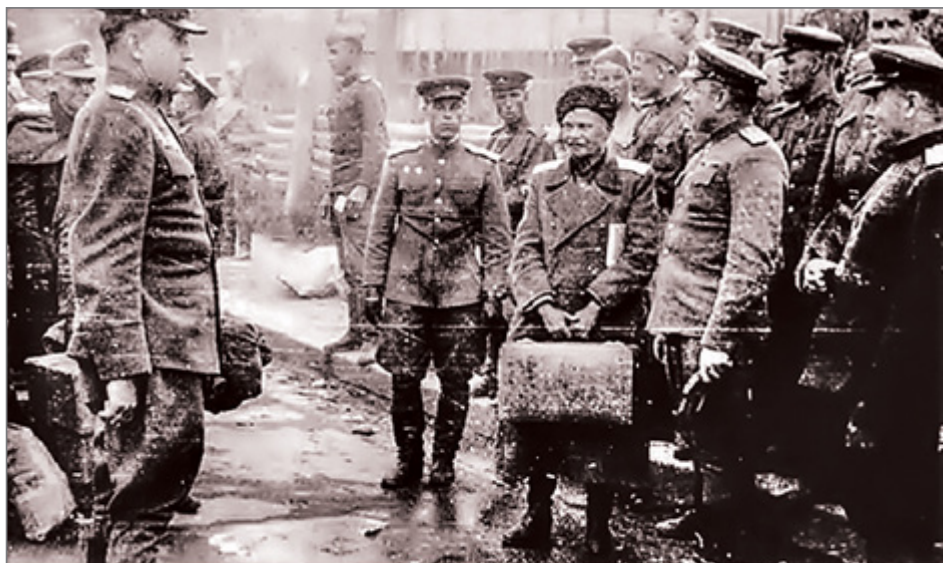
Передача союзниками представителям РККА группенфюрера СС А. Шкуро.

наказания. С рядовыми казаками поступили так же, как с другими приспешниками оккупантов. После рассмотрения дела каждый получал приговор соразмерно со степенью своей вины. В 1955 г. по указу Президиума Верховного Совета СССР «Об амнистии советских граждан, сотрудничавших с оккупационными властями в период Великой Отечественной войны», казаки были амнистированы.