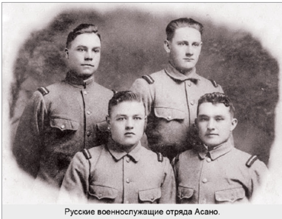
Русские военнослужащие отряда Асано.

Красной армии. Этим японцы избегают объявления войны СССР» 60 . Публикации Семенова в эмигрантской печати в полной мере характеризуют его как фашиста. Он шлет поздравления Гитлеру с днями рождения, ликует по поводу победы Германии над европейскими странами, желает успехов на Восточном фронте. Провал блицкрига под Москвой и поражение вермахта под Сталинградом стали для него личными трагедиями.