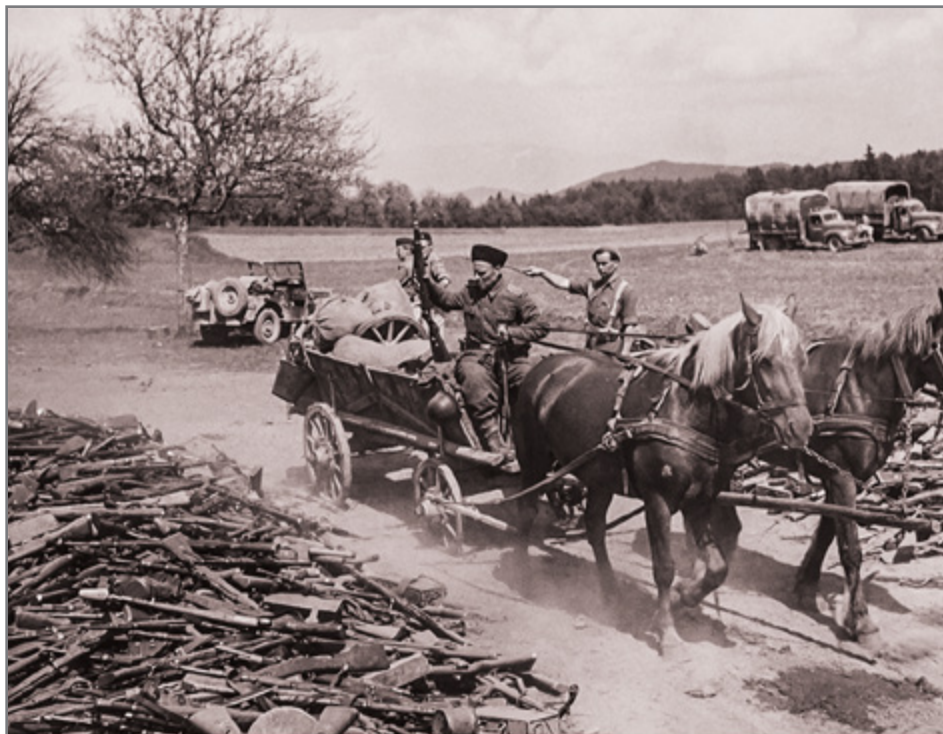
Сдача оружия в Лиенце.

шинство состава корпуса Паннвица были советскими гражданами, отступившими из СССР с немцами, и их были обязаны возвратить на родину. Ни в коем случае нельзя говорить о том, что члены Казачьего стана или казачьих войск СС были не согласны с политикой Сталина и опасались репрессий, поэтому ушли с немецкими войсками. Они не жертвы, а предатели и прислужники оккупантов, совершившие множество военных преступлений. В отношении каждого из них как минимум необходимо было провести следственные действия, чтобы установить степень участия в боях на стороне Германии. Действия британцев были правильными, так как союзники руководствовались доктриной Антигитлеровской коалиции, боровшейся с нацизмом.