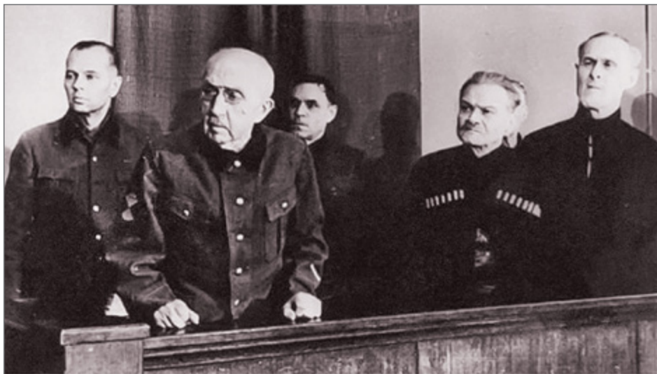
Г. фон Паннвиц, П. Краснов, Т. Доманов, А. Шкуро, С-Г. Клыч во время вынесения приговора. 16 января 1947 г.

казачеством, которое в основном поддержало советскую власть, проводившую политику, установившую социальную справедливость в землепользовании и равноправие в обществе.