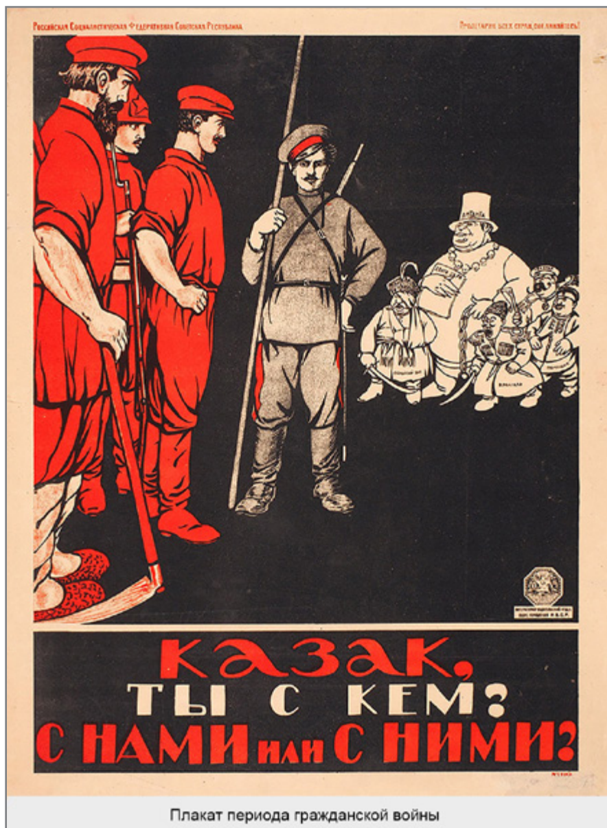
Плакат периода гражданской войны

речия с иногородними и горцами, тем сильнее были антисоветские настроения, но положение, когда у одной социальной группы земли в несколько раз больше, чем у других, не могло сохраняться вечно. Наиболее справедливым способом передела земли стала ее социали-