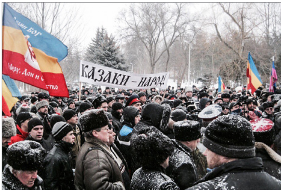
Митинг с требованием признать казаков народом 26 января 2013 г. в Ростове-на-Дону.

цию в установленный срок не ответило. Департамент по делам казачества Краснодарского края ответил следующее: «В целом согласны с Вашей позицией, высказанной в обращении. В настоящее время департаментом, учитывая положения Федерального закона “О национально-культурной автономии” и постановления Законодательного Собрания Краснодарского края “Об утверждении Концепции государственной политики Краснодарского края в отношении кубанского казачества”, разрабатывается вопрос об идентификации национальности “казак” и официальном закреплении данного положения». Комитет Ставропольского края по делам национальностей и казачества дал уклончивый ответ: «Что касается вопроса признания казаков народом, то мы считаем, что данная инициатива должна исходить только от самих казаков, а не от представителей власти. Никто и ничто не препятствует казакам в рамках современного российского законодательства бороться за реабилитацию казачества и признание казаков народом». Министерство по делам национальностей и казачества