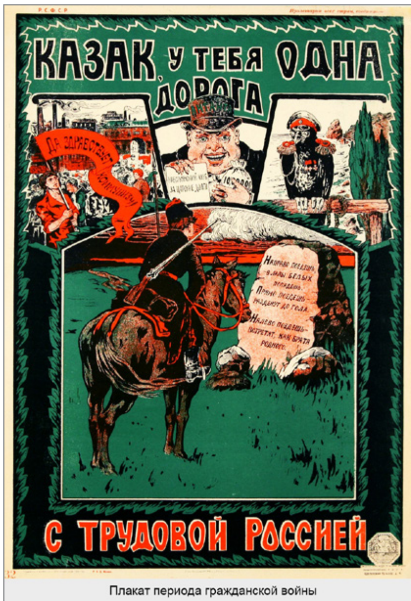
Плакат периода гражданской войны

лие, различные привилегии и др.) всеми силами стремятся сохранить существующую экономическую конфигурацию. Прогрессивные общественные группы, наоборот, всеми силами двигают развитие общества вперед, что неизбежно приводит к конфликту. Как же понять,