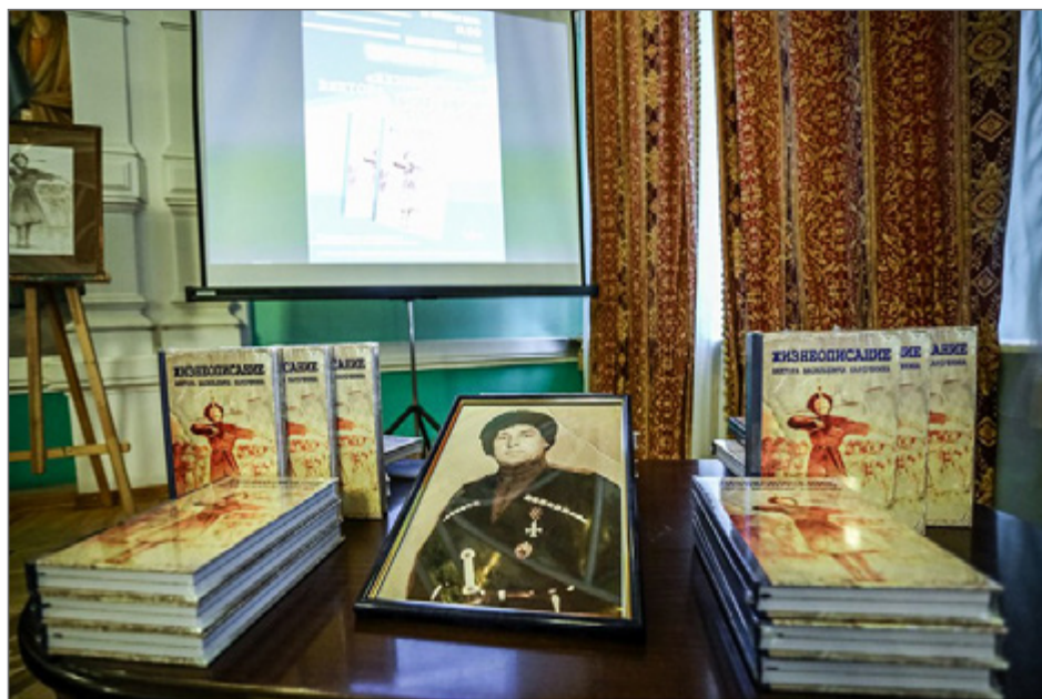
Книга воспоминаний нацистского коллаборанта В. Карпушкина, изданная в 2021 г. в Ставропольском крае.

В Чехословакии Карпушкин был одним из основоположников казачьего сепаратизма, членом редакции и постоянным авто-