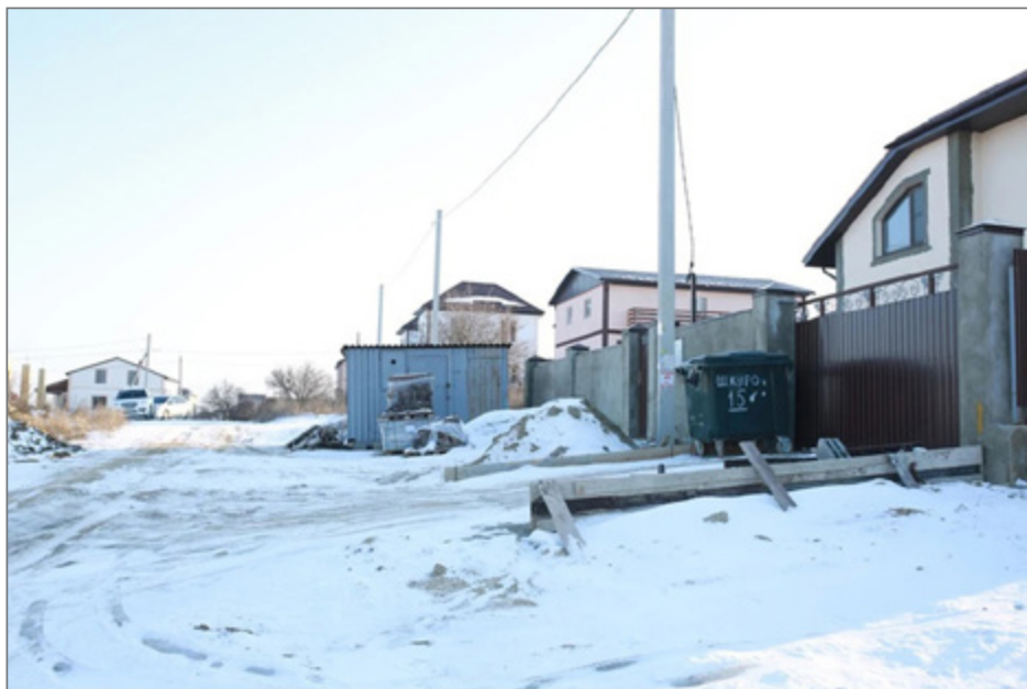
Улица имени А. Шкуро в Новороссийске.