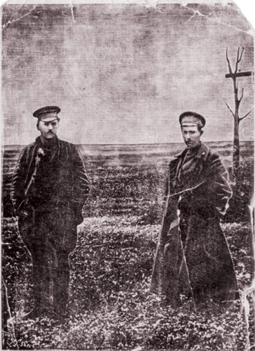
Красные казаки, товарищи Подтелков и Кривошлыков, у виселицы перед казнью.

Красные казаки Ф.Г. Подтелков и М.В. Кривошлыков были казнены белоказаками 11 мая 1918 г.