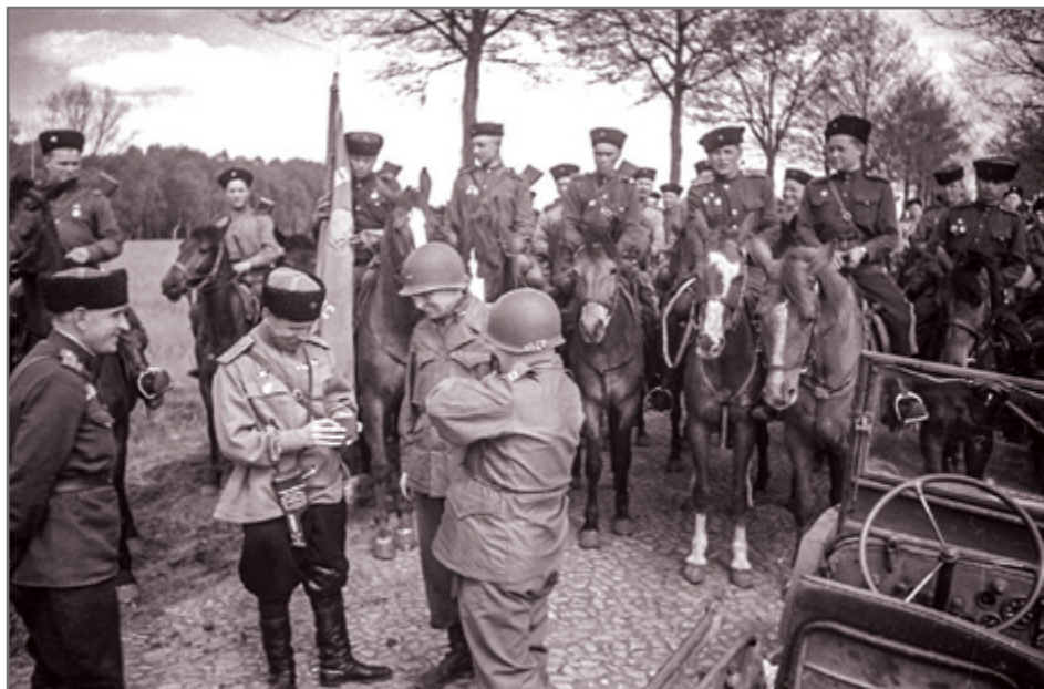
Казачи 3-го гвардейского кавалерийского корпуса на встрече с американскими офицерами в Германии. Снимок сделан во время встречи с союзниками на Эльбе, апрель 1945 г.

Часть казаков, воевавших на стороне фашистов, смогла избежать выдачи в СССР. Они перебрались в зоны оккупации союзников, а потом в Южную Америку и США, как и многие другие сторонники фашизма. Во время «холодной войны» многие из них стали пропагандистами на антисоветских радиостанциях, начали издавать новые антисоветские газеты и журналы, вести активную общественную деятельность, продолжив бороться с Россией новыми методами, разработанными в центрах информационно-психологических операций США и НАТО.