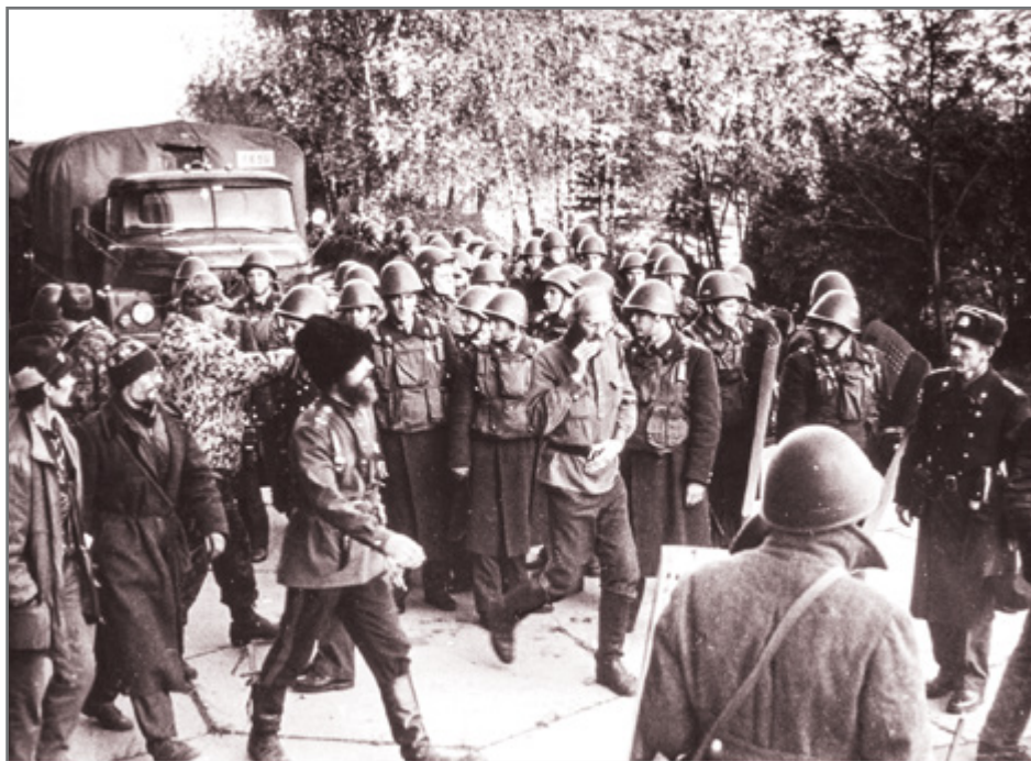
Казачи во время событий 1993 г. в Москве.

тегических партнеров неомонархического общества «Царьград» 181 . Они проводят совместные исторические акции, ведут скоординированную информационную деятельность. В частности, казаки и «Царьград» требуют убрать из названий улиц в российских городах упоминания о Я. Свердлове, совершенно необоснованно считая его виновным в репрессиях против казаков 182 . В течение многих лет 24 января казачьи организации и общество «Царьград» организуют мероприятия в память о «геноциде казаков», который, по их мнению, начался с принятия циркулярной инструкции Оргбюро ЦК РКП (б) по казачьему вопросу. Данное событие используется как повод для объединения казаков через прививание им комплекса жертвы. Им внушается мысль о том, что большевики хотели «истребить» их предков или «сделать рабами». Казаки героически сопротивлялись «порабощению», но были вынуждены погибнуть, покориться или уйти за границу. Всего, как рассказывают казакам, к 1930-м гг. осталось 10% от численности казаков в Российской империи. Никто, конечно,