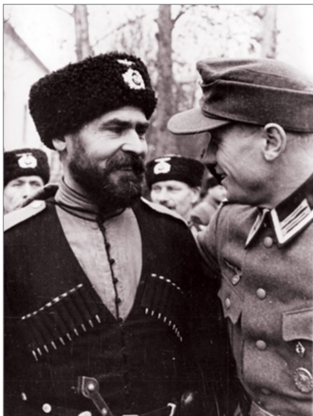
Казак из состава Русского охранного корпуса в Сербии с немецким унтер-офицером в Белграде. 1942 г.

Тем не менее, по согласованию с немцами, КНОД расширил свою пропагандистскую деятельность на другие страны Европы и