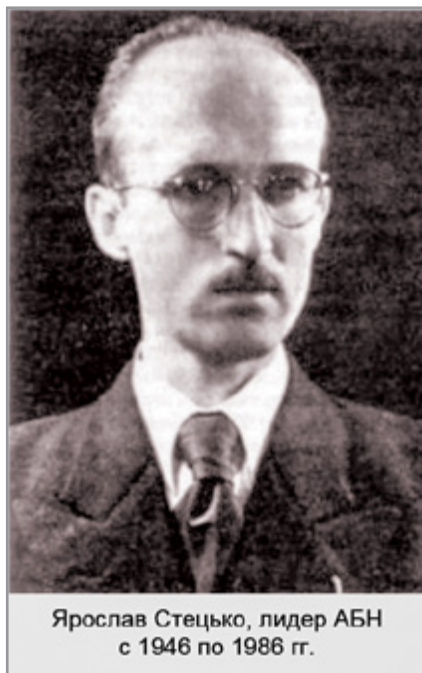
Ярослав Стецько, лидер АБН с 1946 по 1986 гг.

группировок, состоящих в Антибольшевистском блоке народов, тоже имели свои представительства в Мюнхене и получали неограниченную поддержку со стороны организаций, связанных с США. Их участники разрабатывали различные тайные операции, пытались вести подрывную деятельность в СССР и социалистических странах Европы.