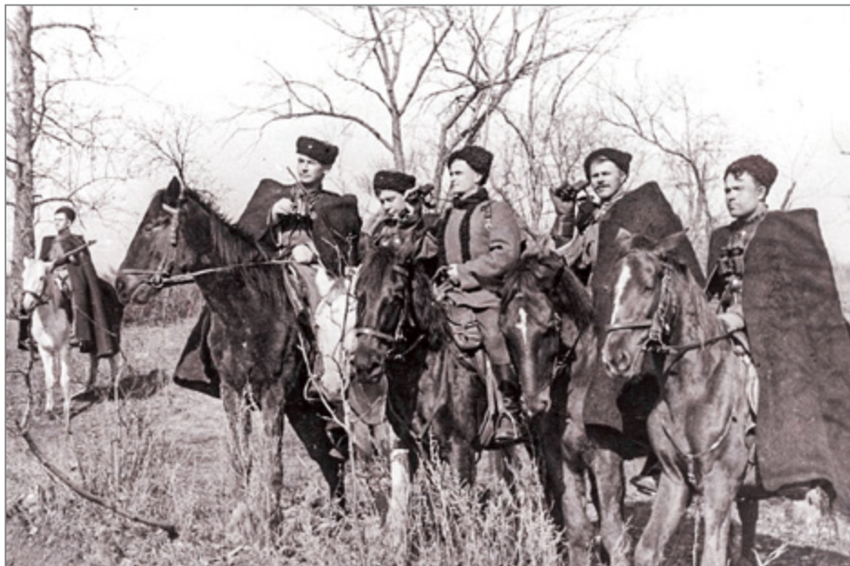
Командиры казачьего гвардейского полка Красной армии изучают местность перед выполнением боевой задачи.

татар, взяв в плен 23 человека, и по моему приказу расстреляли их на месте. Кроме того, было захвачено в плен 45-50 партизан, тоже потом расстрелянных. В итоге этой операции было убито около 600 партизан. Между 10 и 21 марта 1943 г. двумя батальонами полка была предпринята карательная акция против партизан в лесу северо-восточнее Полоцка. Захвачено в плен и расстреляно 7 партизан» 85 .