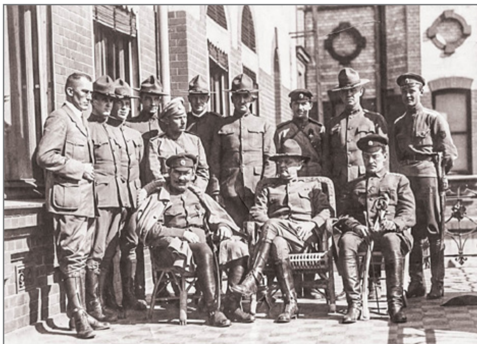
Американские солдаты с русскими офицерами во Владивостоке. Рядом с атаманом Г.М. Семеновым генерал-майор Уильям Сидни Грейвс, командующий 8-й пехотной дивизией, которая была основой американских Экспедиционных сил в Сибири.

После установления советской власти на Дальнем Востоке, недобитые части армий А.В. Колчака, атамана Г.М. Семенова, различные белогвардейские и казачьи формирования ушли в Маньчжурию и другие районы Китая. В это время в Китае шла гражданская война, и тысячи казаков пошли в наемники в воинские формирования местных князьков-милитаристов, а также нанялись на службу Японии, которая в это время активизировала захватническую политику в Юго-Восточной Азии. В составе казачьих войск было много людей, хорошо знавших военное дело, прошедших Первую мировую и