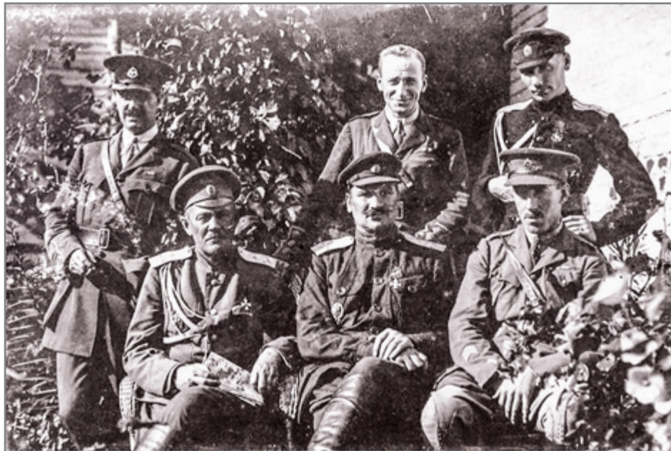
Командиры 2-й Донской дивизии с английскими офицерами, лето 1919 г.

Националистические и сепаратистские движения на казачьих территориях сразу попали в поле зрения спецслужб стран Антанты и САСШ (Северо-Американских Соединенных Штатов). Готовясь к военному вторжению в Россию, эти страны провели серьезную подготовительную работу с руководством Дона, Кубани и других территорий, где агенты этих государств искали сторонников среди местных антибольшевистских элементов. В начале 1918 г. деятельность спецслужб была главным методом интервенционной политики. Документы военной разведки Великобритании этого периода позволили английской исследовательнице А.Ж. Плотке говорить о «разведывательной интервенции», которая предшествовала военной. В январе в Ростове-на-Дону и Новочеркасске побывал консул Соединенных Штатов Д. К. Пул 11 , здесь он встретился с генералом В.М. Алексеевым и атаманом А.М. Калединым, с целью оценки возможностей