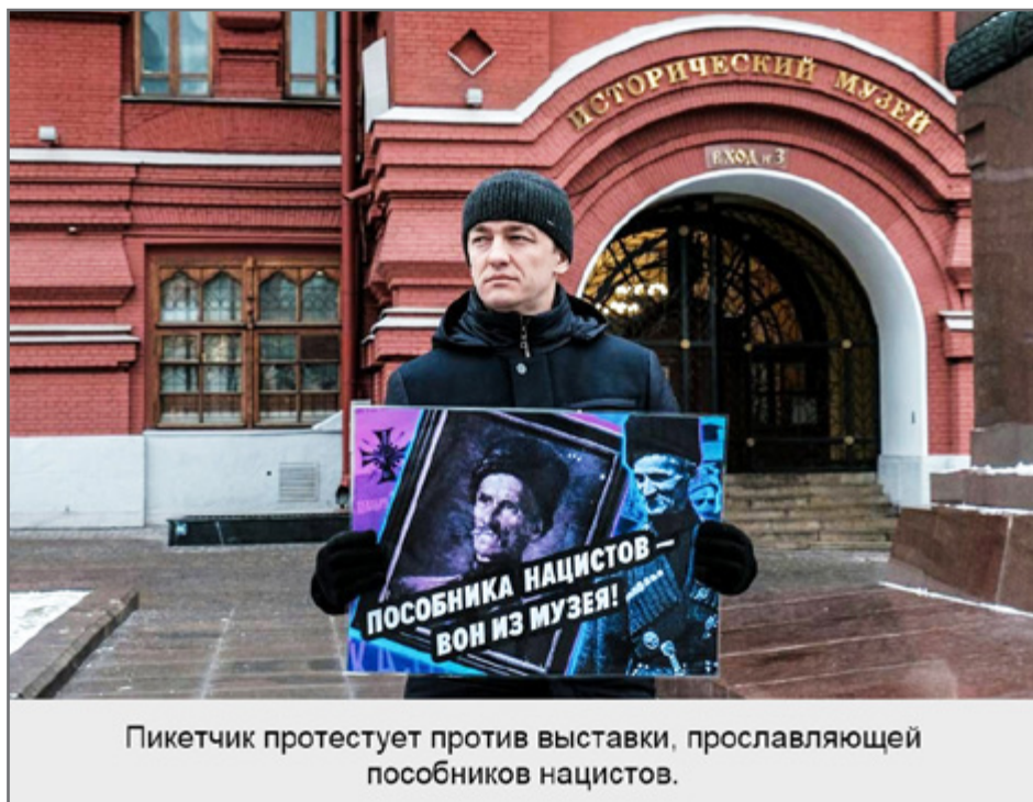
Пикетчик протестует против выставки, прославляющей пособников нацистов.

упоминания о том, что он являлся пособником нацистов. После серии пикетов, проведенных у музея активистами общественного движения «Суть времени», портрет убрали 208 .